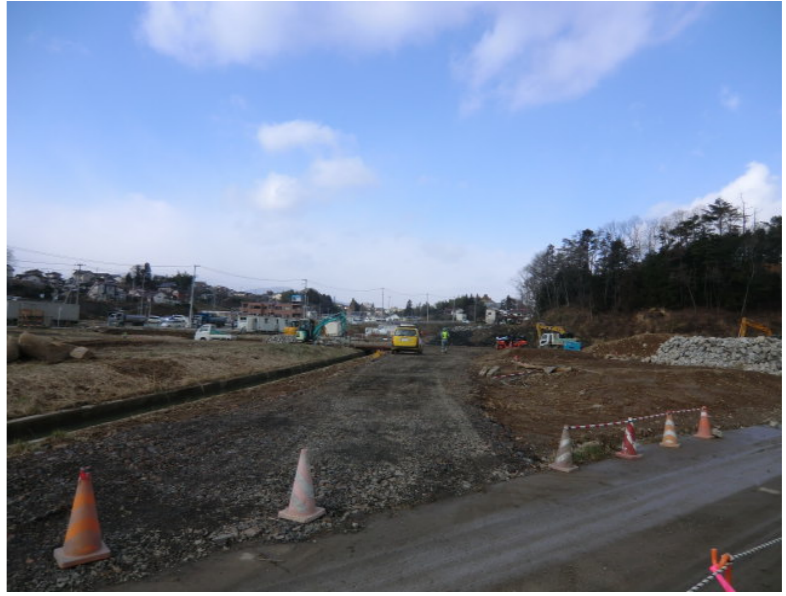
橋台床掘準備状況