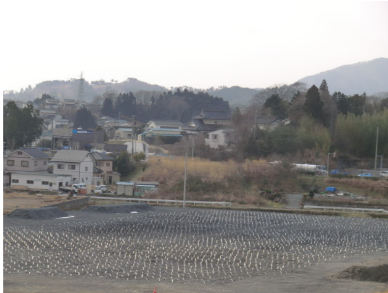
軟弱地盤対策工完了状況