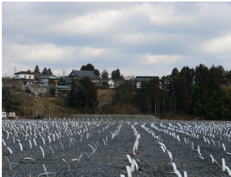
軟弱地盤対策工完了状況