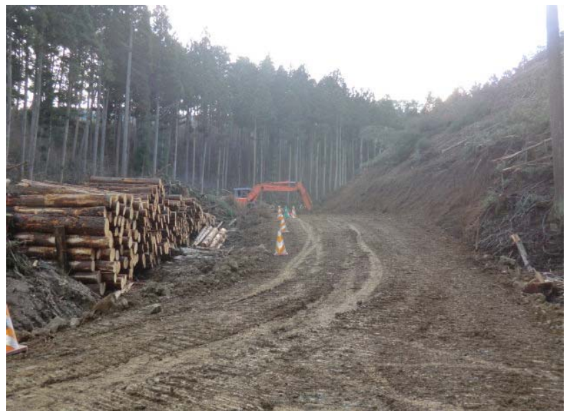
立木伐採・進入路造成状況