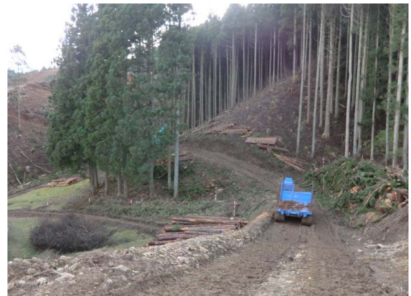
立木伐採・進入路造成状況