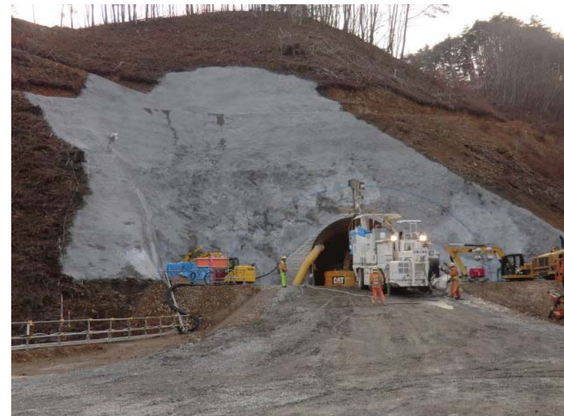
トンネル坑口付状況