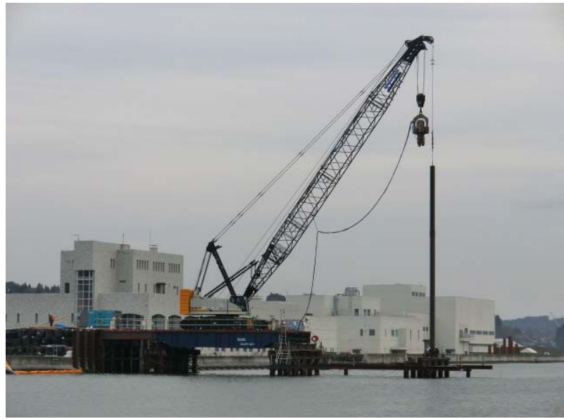
仮設構台施工状況