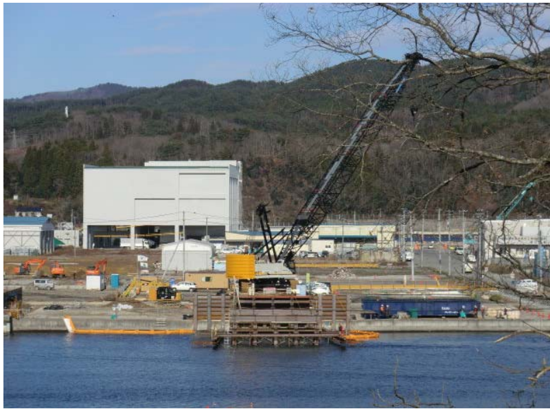
仮設構台施工状況