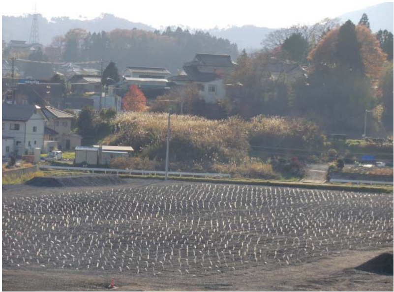
軟弱地盤対策工完了状況