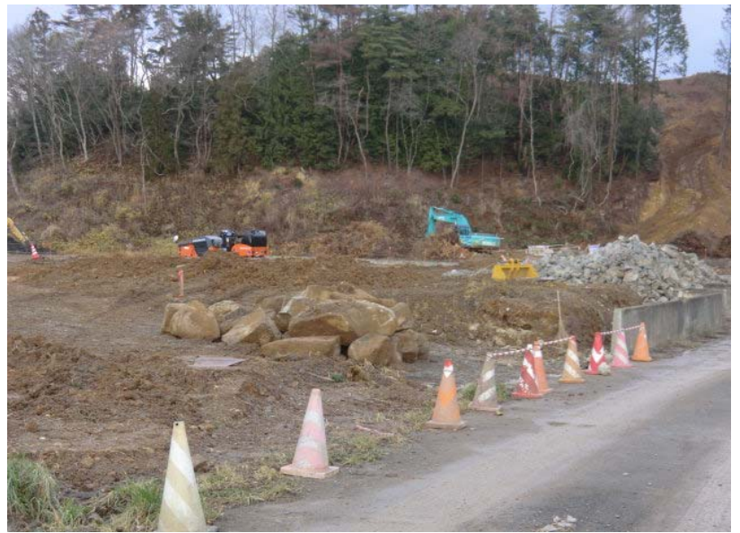
橋台床掘準備状況