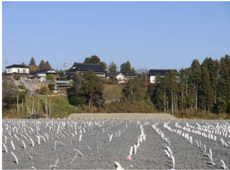
軟弱地盤対策工完了状況