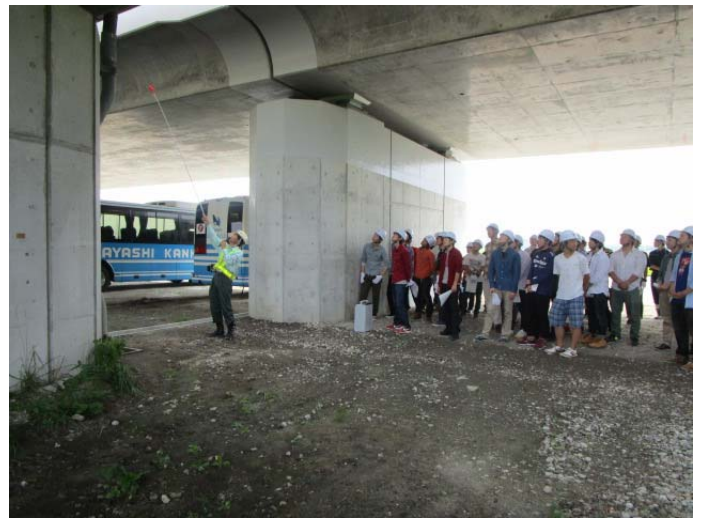
▲供用している橋梁と新橋梁の比較