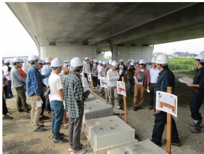
▲コンクリート養生試験体の説明