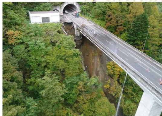
▲土砂崩落状況(遠景)