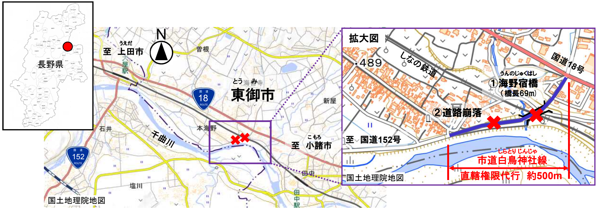
うんのじゅくばし 【①海野宿橋(1)】