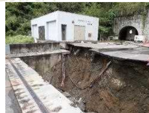
▲橋台背面土砂崩落状況