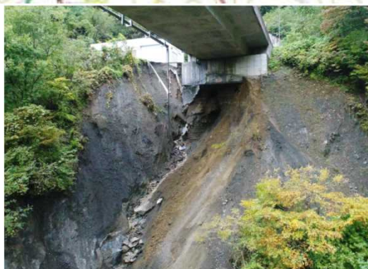
▲土砂崩落状況(橋梁下方より撮影)