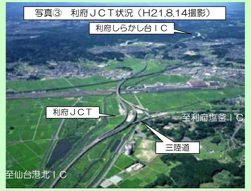
写真③ 利府JCT状況 (H21.8.14撮影)