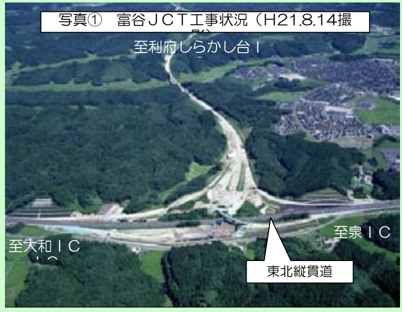
写真① 富谷JCT工事状況 (H21.8.14撮)