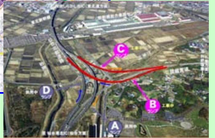
▲ 利府JCT (赤線が計画線)