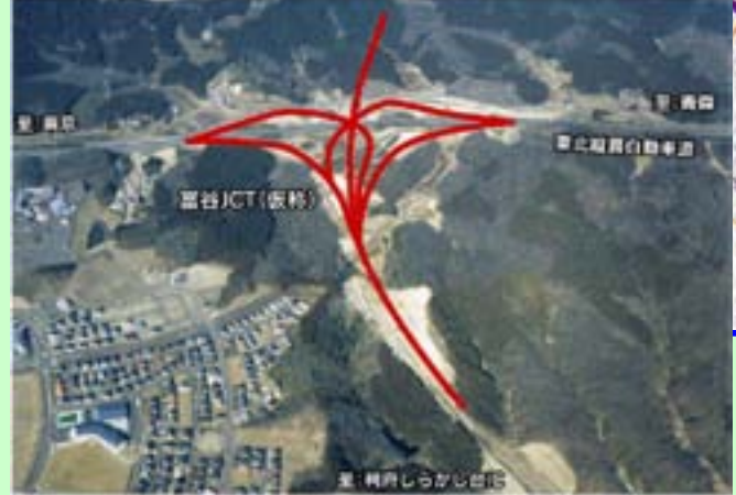
▲ 富谷ジャンクション(JCT) (赤線が計画線)