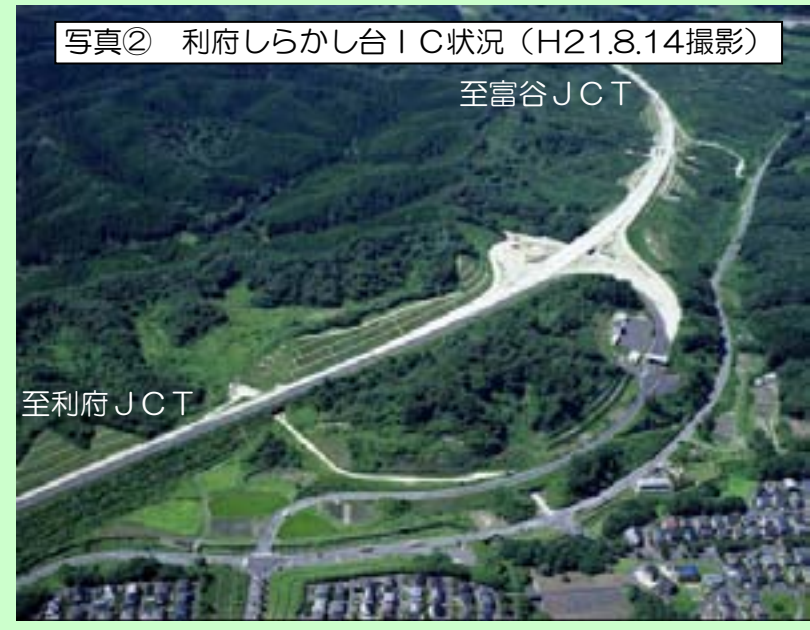
写真② 利府しらかし台IC状況 (H21.8.14撮影)