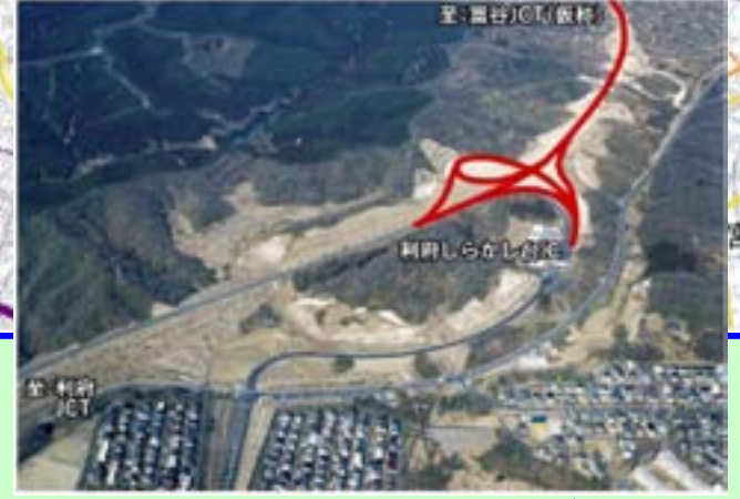
▲ 利府しらかし台IC周辺 (赤線が計画線)