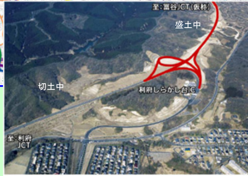
▲ 利府しらかし台IC周辺 (赤線が計画線)