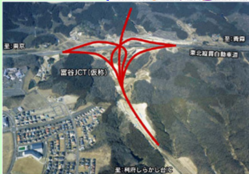
▲ 富谷ジャンクション(JCT) (赤線が計画線)