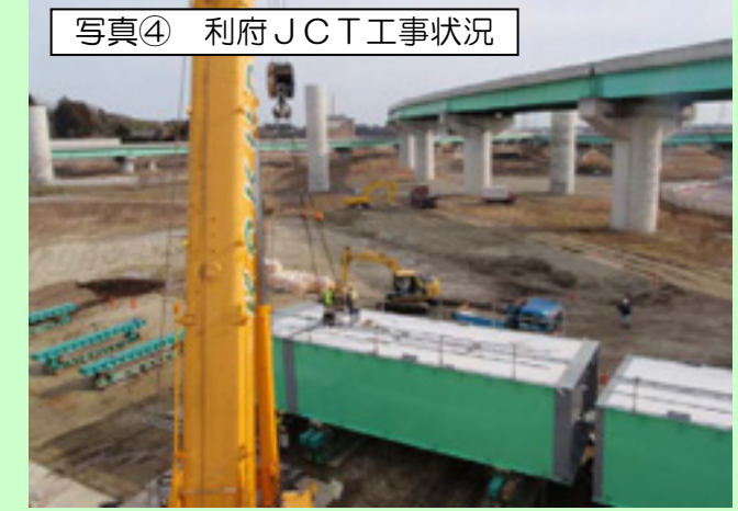
写真④ 利府JCT工事状況