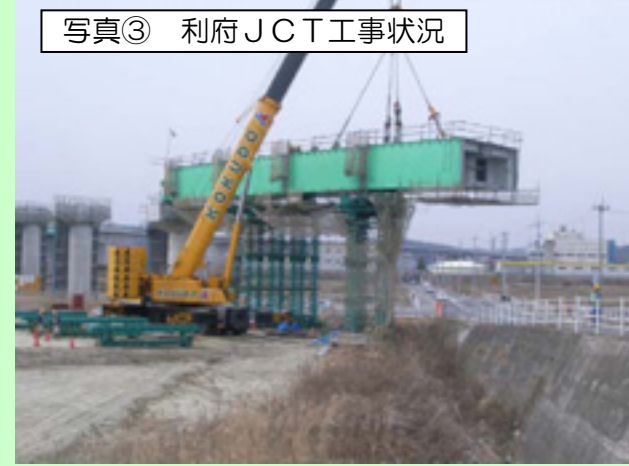
写真③ 利府JCT工事状況