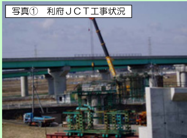
写真① 利府JCT工事状況