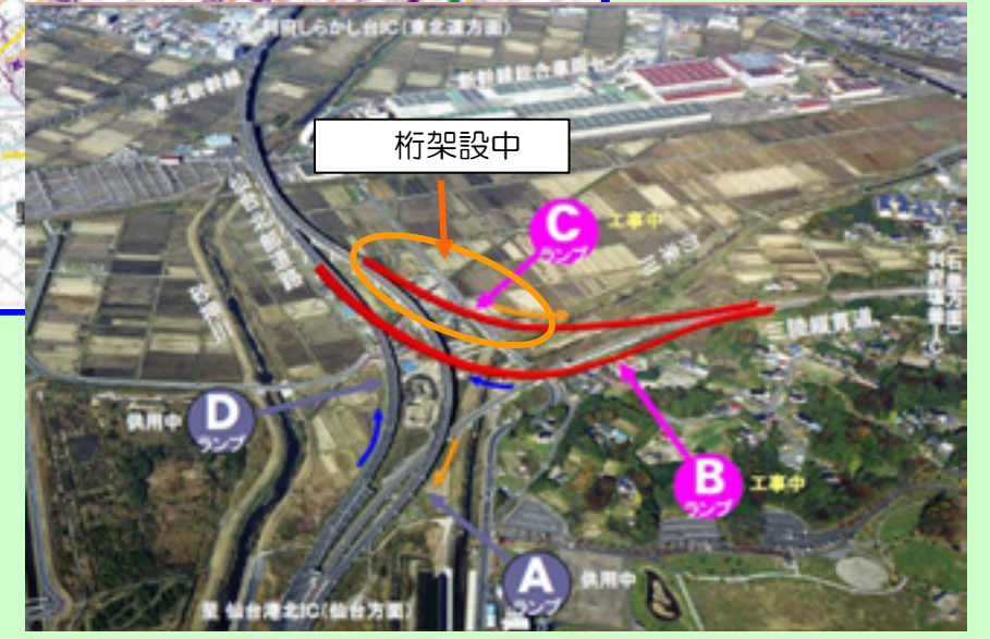
▲ 利府JCT (赤線が計画線)