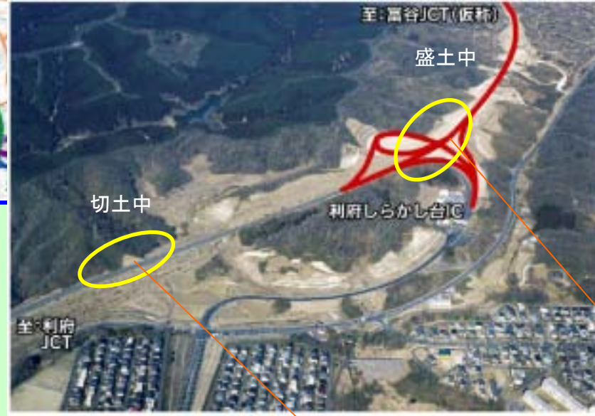
▲ 利府しらかし台IC周辺 (赤線が計画線)