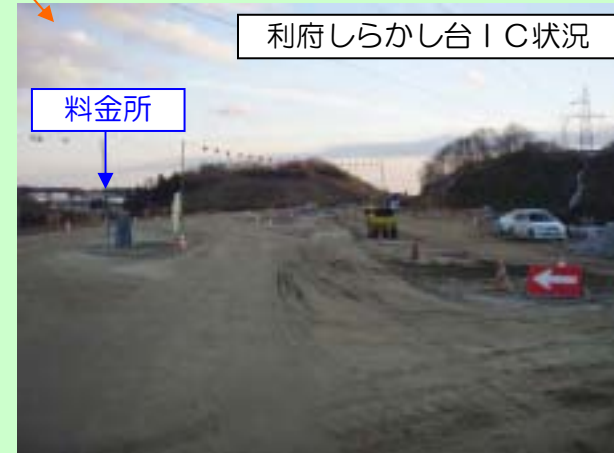
利府しらかし台IC状況