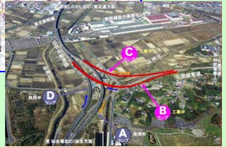
▲ 利府JCT (赤線が計画線)