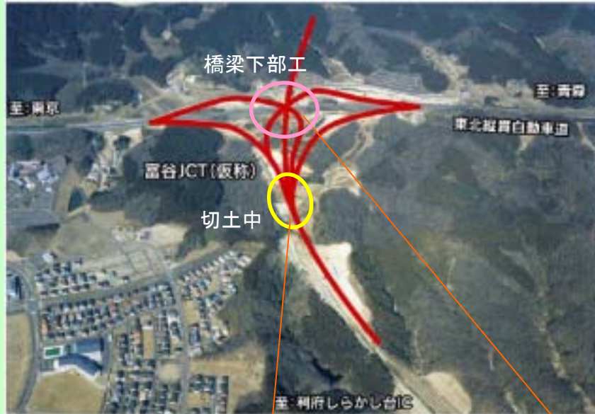
▲ 富谷ジャンクション(JCT) (赤線が計画線)