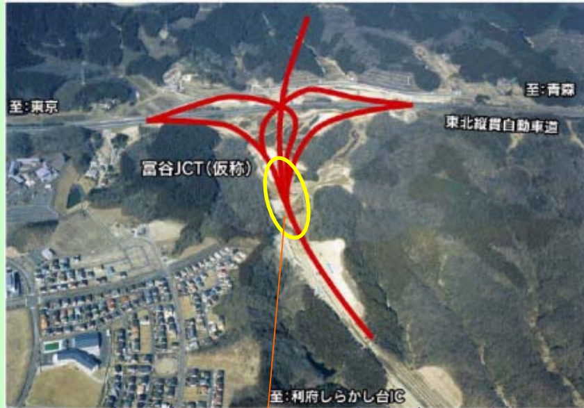
▲ 富谷ジャンクション(JCT) (赤線が計画線)