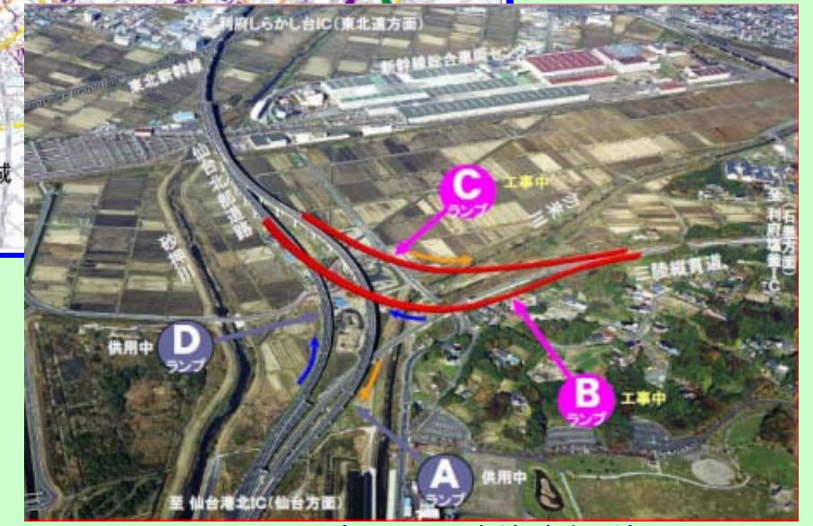
▲ 利府JCT (赤線が計画線)