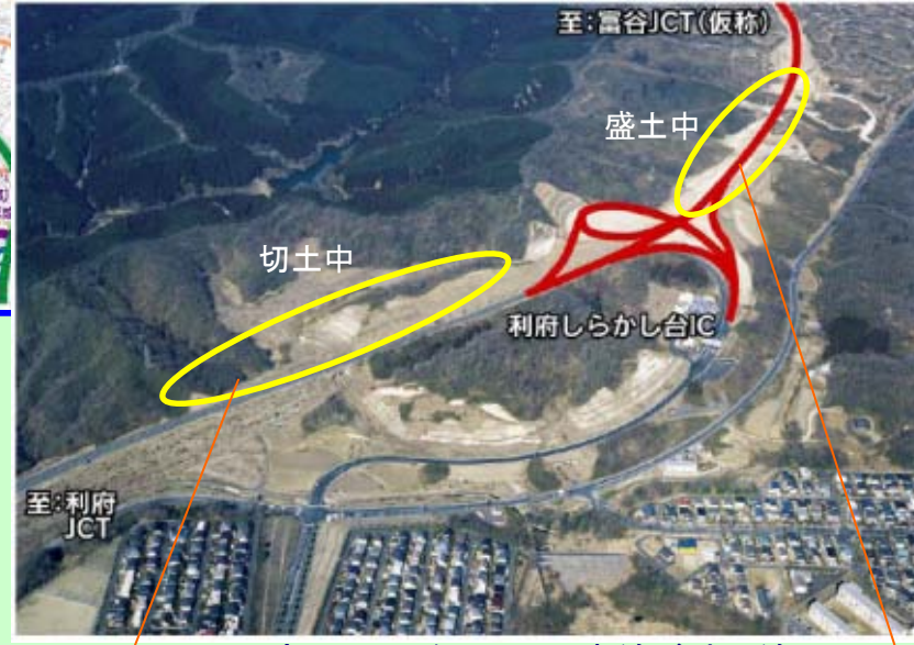
▲ 利府しらかし台IC周辺 (赤線が計画線)