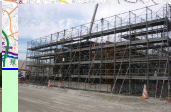
▲③ 北部道路を横断するための函渠を作っています。