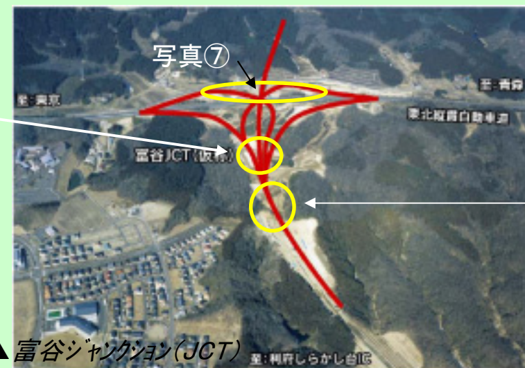
▲富谷ジャンクション(JCT)