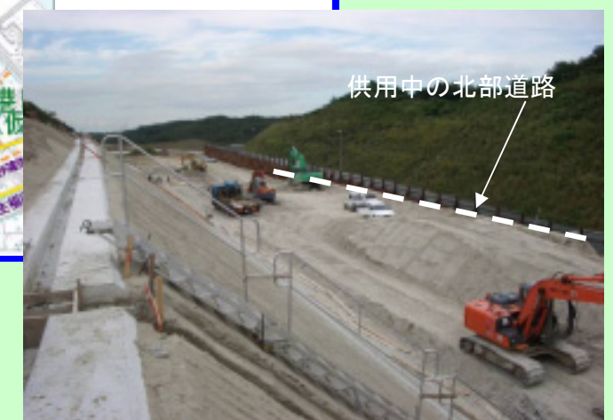
▲① 利府しらかし台IC隣接部の切土工事を行っています。