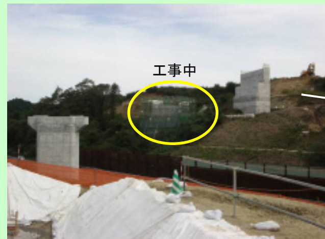
▲⑥ 東北道を跨ぐ橋の下部工も鋭意工事しています。