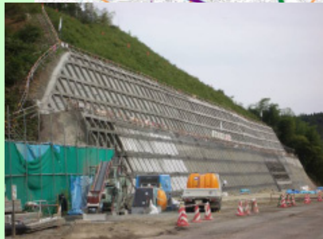
▲④ 石積地区では法面工事が行われています。