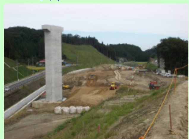
▲⑦ NEXCOによりジャンクション内の盛土工事も行われています。