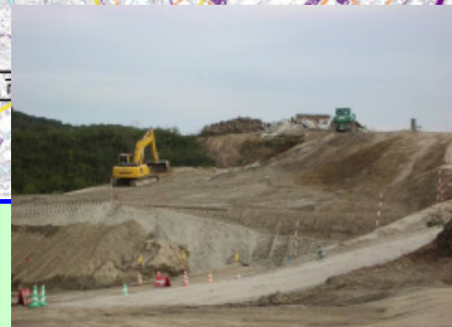
▲② 盛土工事も鋭意行われています。