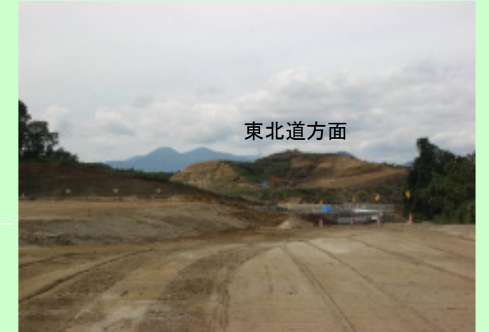
▲⑤ 富谷JCT付近の切土も順調に行われています。