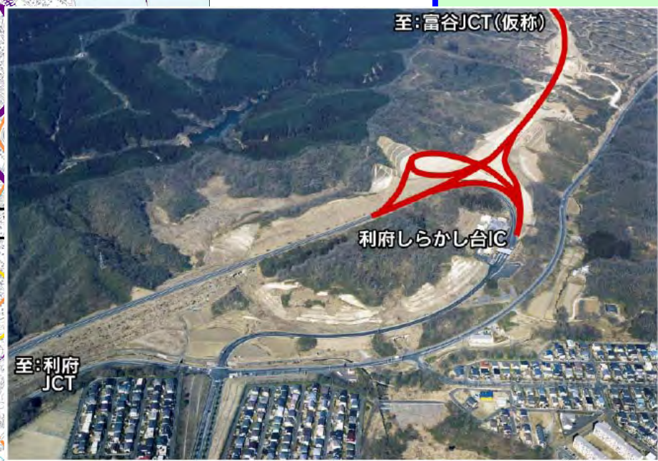
利府しらかし台IC周辺(赤線が計画線) [凡例] ← 航空写真方向