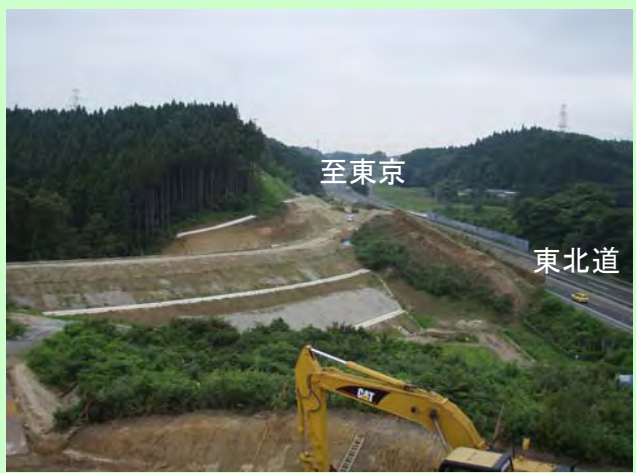
▲⑦ 東北道とジャンクション部