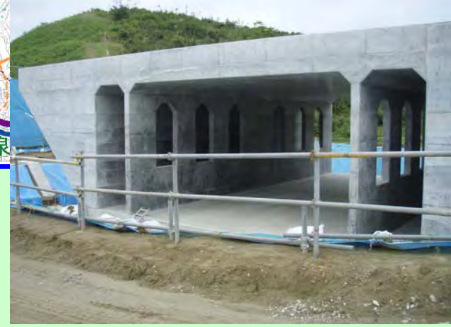
▲③ 北部道路を横断するための函渠を作っています。