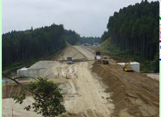
▲④ 盛土工事を行っています。