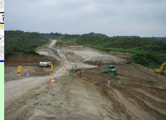
▲② 盛土工事を行っています。