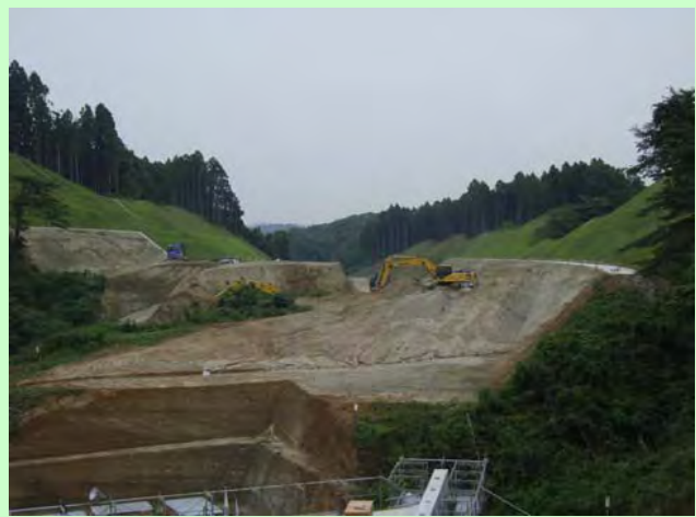
▲⑤ 切土工事を行っています。