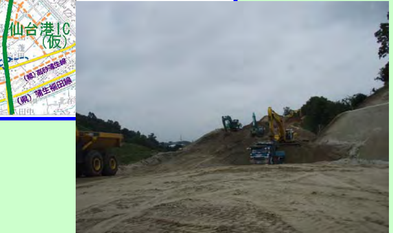
▲① 利府しらかし台IC北側の切土工事を行っています。