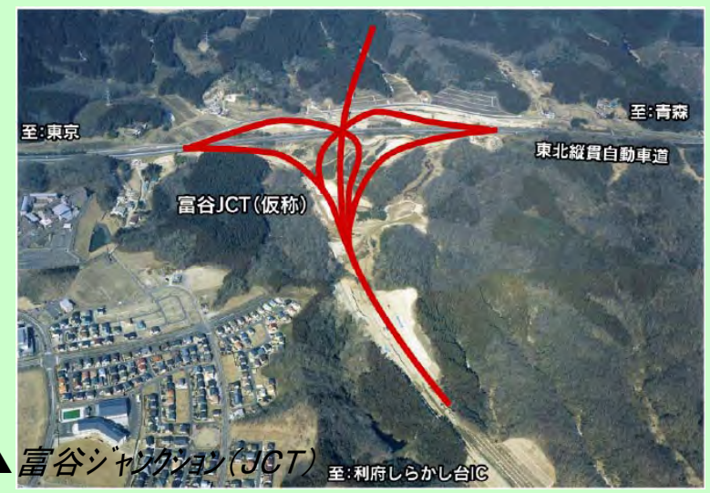
▲富谷ジャンクション(JCT) 至: 利府しらかし台IC