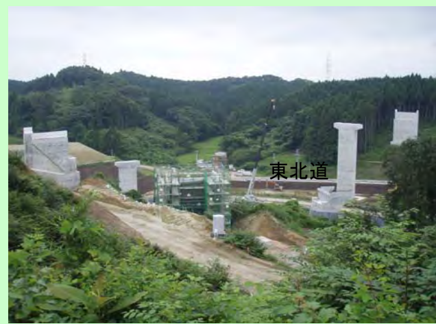
▲⑥ 東北道とジャンクション部