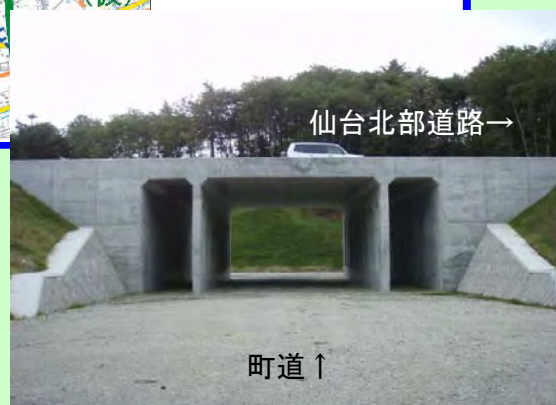
▲① 仙台北部道路を横断する函渠(町道)が完成しています。