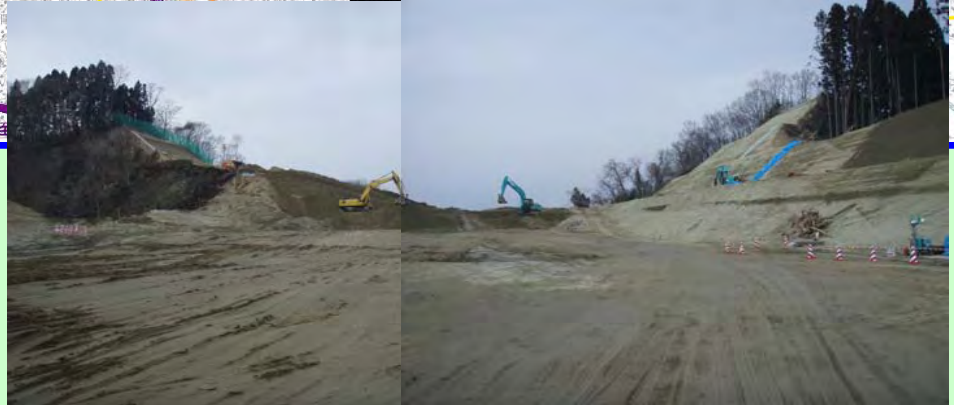
▲③ 切土工事を行っています。