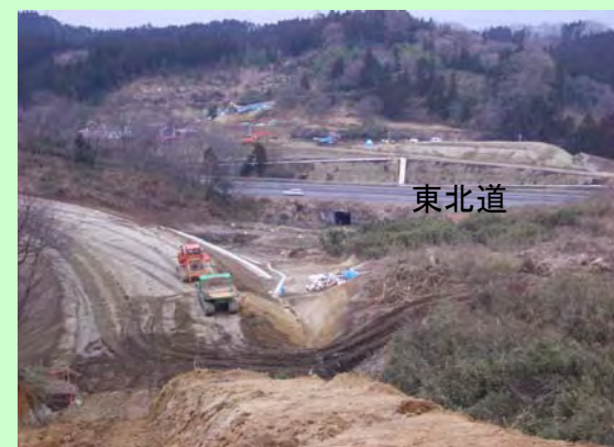
▲④ 東北道とジャンクション部