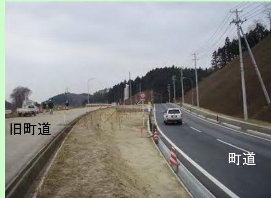
▲⑥ 町道の付け替えが完了。