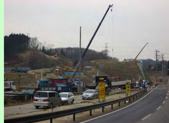
▲⑤ ジャンクションの工事状況