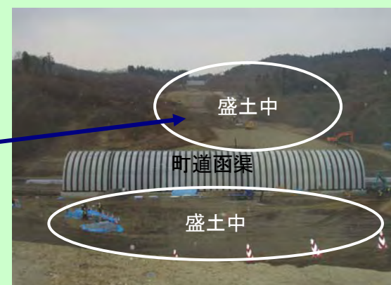
▲② 盛土工事を行っています。