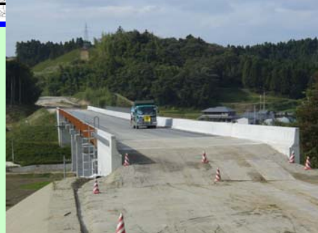
▲⑤ 石積高架橋(仮称)は工事用道路として利用しています。