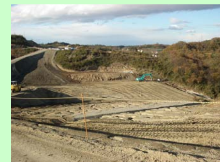
▲② 盛土工事を行っています。