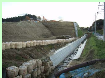
▲⑧ 東北道とのジャンクションや河川の付け替えなどの工事を行っています。