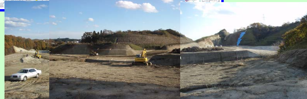
▲① 土工工事や排水側溝設置などの工事を行っています。