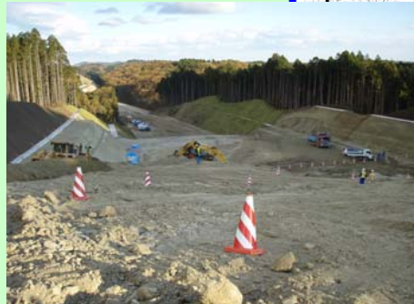
▲⑦ 切土工事を行っています。