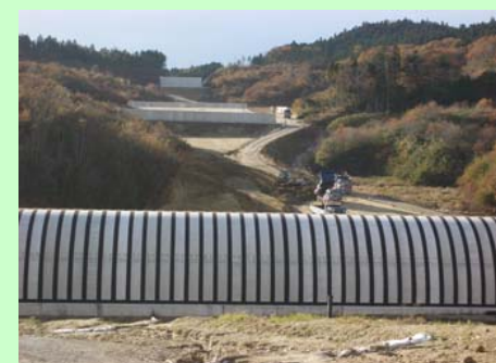
▲④ 盛土工事を行っています。