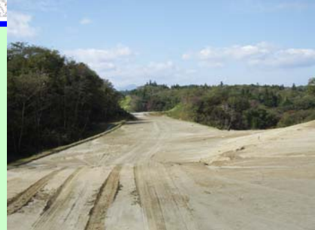
▲③ 盛土工事を終わっています。