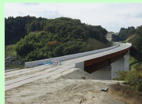
▲⑥ 成田高架橋(仮称)は工事用道路として利用しています。