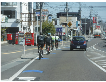
(矢羽根設置箇所の走行状況)

2018年より、矢羽根(青色)の設置や自転車ピクトグラムの設置などの自転車走行空間の整備を実施しています。