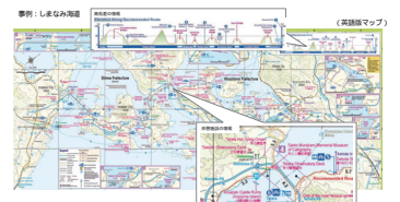
水濡れに強いルートマップ