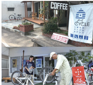
サポート施設の拡大