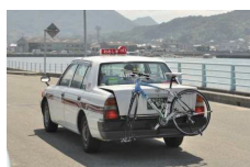
自転車を輸送するタクシーサービス(例)