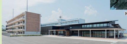
東日本大震災遺構・伝承館 (気仙沼市)