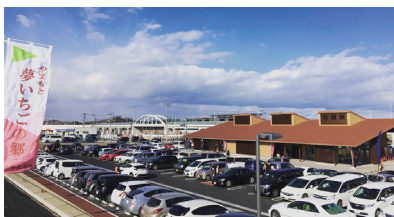
▲ゲートウェイ候補 やまもと夢いちごの郷

レンタサイクル又はシェアサイクルの利用 / サイクリングに必要な情報発信 / 必要な物品や食事の販売 / 手荷物用ロッカー・着替えのスペースなどの整備等