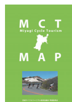
多言語による案内MAP事例