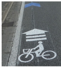
(自転車ピクトグラムの設置状況)