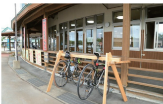
道の駅における駐輪ラック設置例