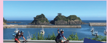
海沿いをサイクリング(石巻市)