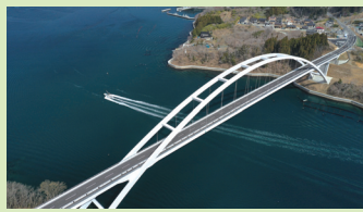
気仙沼大橋(気仙沼市)

沿岸地域における漁業・海産物等の魅力を活かしつつ、東日本大震災の遺構や伝承施設等を巡るルート (宮城県沿岸地域 基幹ルート: 約 280 km、アクセスルートは主要な交通機関や景勝地と基幹ルートを結ぶルート: 約 90 km)