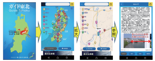
国土交通省開発アプリ「ガイド東北」

サイクリストの誰もがどこでも容易に情報が得られるよう、ルートマップの作成やHP等による情報発信に取り組んでいく予定です。