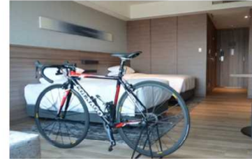
自転車を部屋に持ち込むことができる