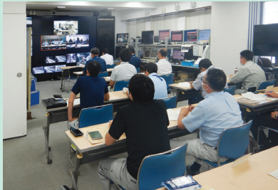
メンテナンス会議

岩手県の道路インフラの予防保全・老朽化対策の体制強化を図るため、県内の高速道路、国道、県道、市町村道の道路管理者からなる「岩手県道路メンテナンス会議」を平成26年に設立しました。令和4年度には「岩手県道路メンテナンス会議」を2回開催した他、道路維持管理業務を担う市町村職員への現地講習会や、広報活動の一環として道路インフラ老朽化対策のポスターを展示しています。