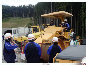
数々の現場見学会・体験学習等を開催