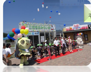
インフォメーションセンター 平成27年8月5日～平成29年12月20日