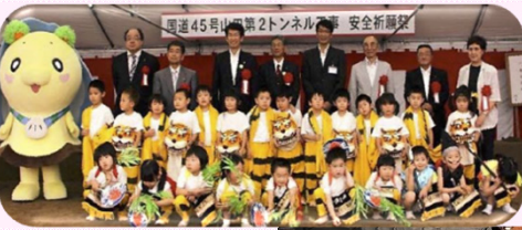
着工安全祈願 貫通式等のイベント