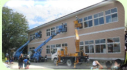
地域の応援(清掃活動、こども110番など)