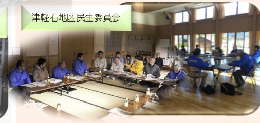
津軽石地区民生委員会