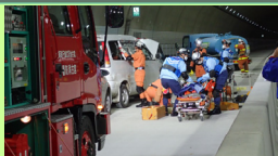
トンネル防災訓練

開通の前に10月30日(火)に田名部トンネルで多重事故を想定した防災訓練を実施。また11月14日(水)に津軽石地区で避難訓練を実施しました。