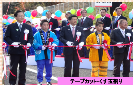
テープカット・くす玉割り