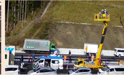
働く車の試乗も大人気！