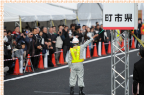
←三上建設監督官によるパレード出発の合図！