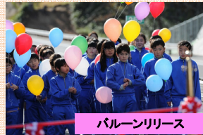
バルーンリリース