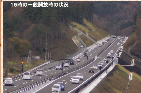
山田町 田名部地区(山田から宮古方面を望む)