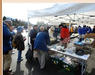
大盛況の食の振る舞い！

開通式典に先立ち、宮古市及び山田町主催による「山田宮古道路」開通イベントが、開催されました。復興道路の状況を展示する「開通記念パネル展」緊急車両や災害対策車などの「はたらく車大集合」、開通前の新しい道路を歩く「開通記念ウォーキング」、地元の皆様による「食の振る舞い」、そしてステージイベントとして、「宮古高等学校吹奏楽部の演奏」、山田南小学校の「虎舞」、津軽石小学校の「さんさ踊り」の披露など多彩な催しで開通を祝いました。