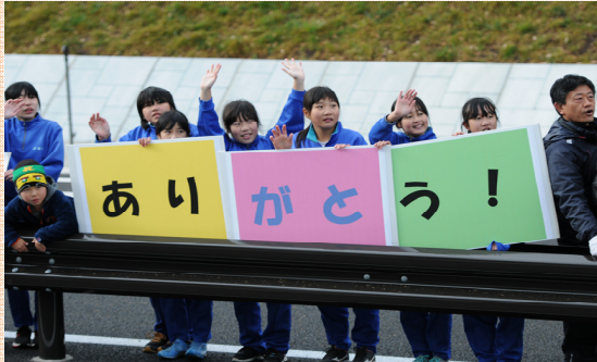
小学校児童によるパレードの見送り