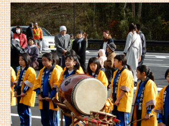
山田南小学校の児童による「虎舞」