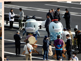
サーモンくん、みやこちゃんもお祝いに！