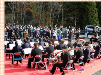
宮古高校吹奏楽部による演奏