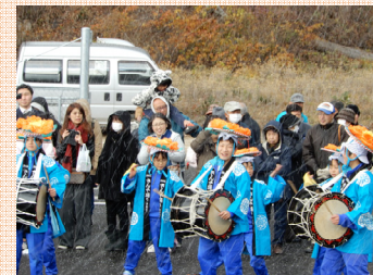
津軽石小学校の児童による「さんさ踊り」