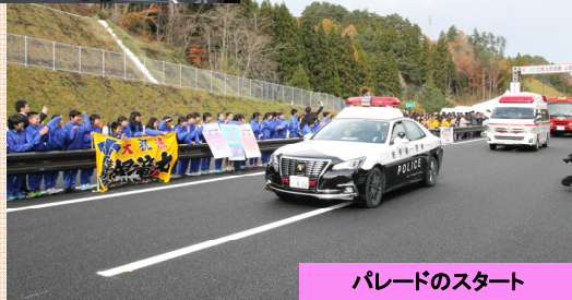
パレードのスタート