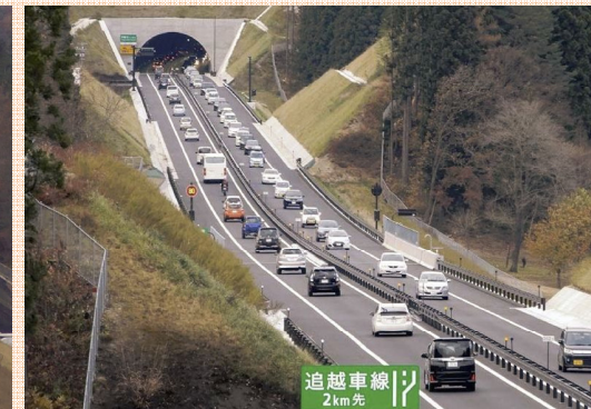
宮古市 荷竹地区～津軽石地区 (山田から宮古方面を望む)