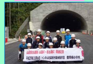
豊間根小学校の皆さん