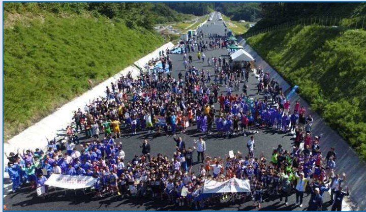
参加者全員による記念撮影

また、会場に設けられた「駅伝及び山田宮古道路開通(11月19日)に向けた寄せ書きコーナー」では多くの参加者が様々な思いを綴られていました。