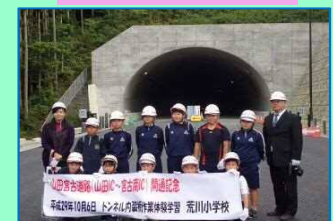
荒川小学校の皆さん