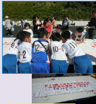
チームの仲間で寄せ書き