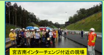
宮古南インターチェンジ付近の現場

10月3日(火)『明日を拓く宮古のみち女性の会』及び宮古市役所職員約50名が、山田宮古道路の津軽石地区及び宮古田老道路の閉伊川橋の現場を見学し、三陸沿岸道路の確かな進捗を実感しました。