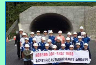
山田南小学校の皆さん