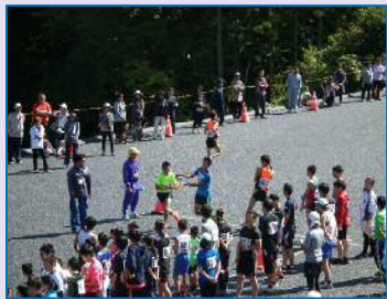
折り返し地点でタスキ渡し