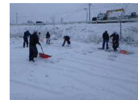
◆保育園駐車場 山田町豊間根地区

現在、工事が全面展開しています。皆様にはご不便をお掛けいたしますが、平成29年度の開通を目標に進めてまいります。工事へのご理解とご協力を何卒お願いいたします。