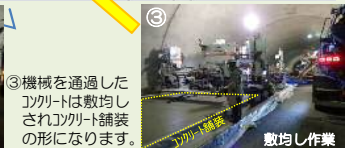
③機械を通過したコンクリートは敷均しされコンクリート舗装の形になります。