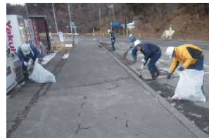
◆国道45号 山田町大沢地区