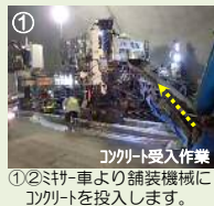
①②ミキサー車より舗装機械にコンクリートを投入します。