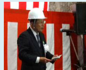
◆祝辞 (山口宮古副市長)