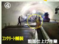
④敷均し後のコンクリート舗装面にホウキ目(細かい線)粗面仕上げをします。