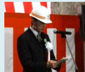
◆挨拶 (永井三陸国道事務所長)