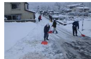
◆通学路(豊間根中学校) 山田町豊間根地区