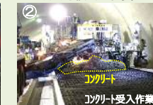
②コンクリート投入作業