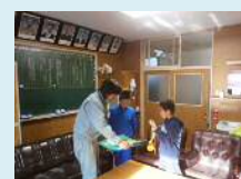
◆児童より「感謝状」をいただきました。