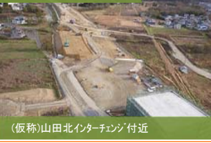
(仮称)山田北インターチェンジ付近 大型機械による盛土作業を実施中。