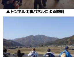
▲秋晴れの長岩森方面を望む!