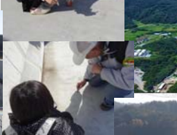
▲橋梁床版部に書き書き!