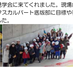
◆低学年児童のみなさん