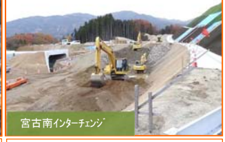
宮古南インターチェンジ 大型重機による掘削作業を実施しています。