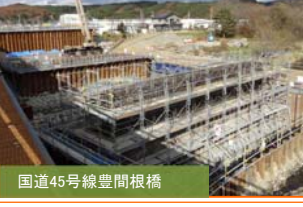
国道45号線豊間根橋 橋梁下部工の鉄筋組立てが完了し、型枠組立て作業実施中。