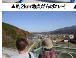
▲豊間根方面を望む!