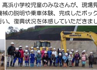
◆高学年児童のみなさん