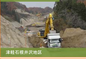
津軽石根井沢地区 大型重機掘削作業と土砂運搬実施中。