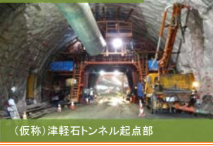
(仮称)津軽石トンネル起点部 覆工コンクリートの打設作業実施中。