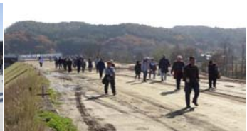
▲橋梁から山々の紅葉を望む!