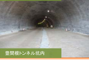
豊間根トンネル坑内 (仮称)トンネル本体工事が完了し、地盤面の段差を無くす為の作業。