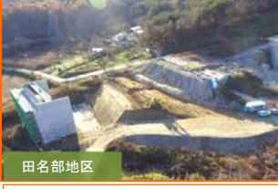
田名部地区 田名部川橋前面部の盛土作業の作業実施。