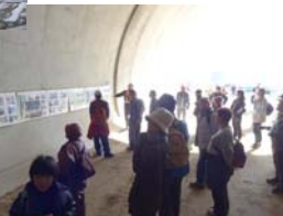
▲トンネル工事パネルによる説明