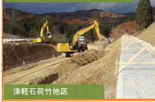
津軽石荷竹地区 切土のり面部、掘削作業を実施しています。