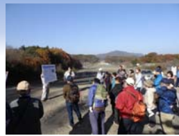
▲スタート前に事業概要説明状況

秋晴れと山肌の紅葉が深まる3.5kmの自然を訪ね、普段立入ることの出来ない現在建設中の現場から望む景観を楽しみながら復興を肌で感じていただきました。