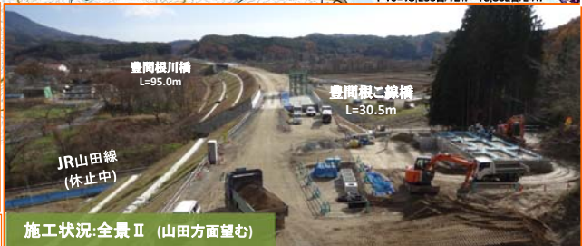
豊間根川橋 L=95.0m 豊間根二線橋 L=30.5m JR山田線 (休止中) 施工状況:全景Ⅱ (山田方面望む)