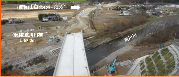
(仮称)山田北インターチェンジ (仮称)荒川川橋 L=67.0m 荒川川