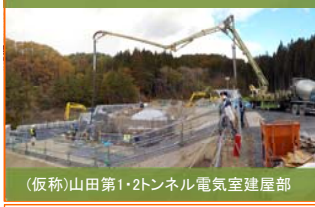
(仮称)山田第1トンネル電気室建屋部 基礎部コンクリート打設作業実施中。