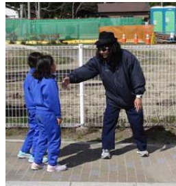
▲訓練状況 (知らない大人に声をかけられる)

三陸国道事務所と山田宮古道路の工事施工者で構成する「山田宮古道路安全連絡協議会」は、宮古警察署及び津軽石小学校と協力し、子ども達の安全確保及びパトロール隊と警察の連携強化を図る一環として、『子ども110番』パトロール隊声かけ訓練を実施いたしました。今後も子ども達の安全を守りながら、安全・安心な工事の推進に努めて参りますので、ご理解とご協力をお願いいたします。(津軽石小学校2年生・3年生の生徒のみなさん56名と一緒に訓練しました。)