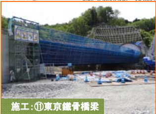
施工:⑪東京鐵骨橋梁