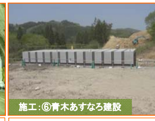
施工:⑥青木あすなろ建設

写真は(仮称)豊間根トンネルです。地下水防止対策でトンネル内にシートを設置しています。