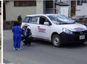
▲訓練状況 (パトロール隊による状況確認と110番通報)