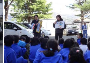
▲安全講話 (宮古警察署、警察官による)

現在、工事が全面展開しています。皆様にはご不便をお掛けいたしますが、平成29年度の開通を目標に進めてまいります。工事へのご理解とご協力を何卒お願いいたします。