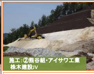
施工:②熊谷組・アイサワ工業 株木建設JV

写真は山田IC(インターチェンジ)予定地です。掘削した土砂を重ダンプにて場内に運搬しています。