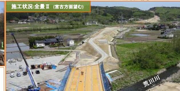
施工状況:全景 II (宮古方面望む)