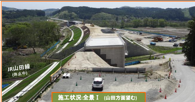
施工状況:全景 I (山田方面望む)