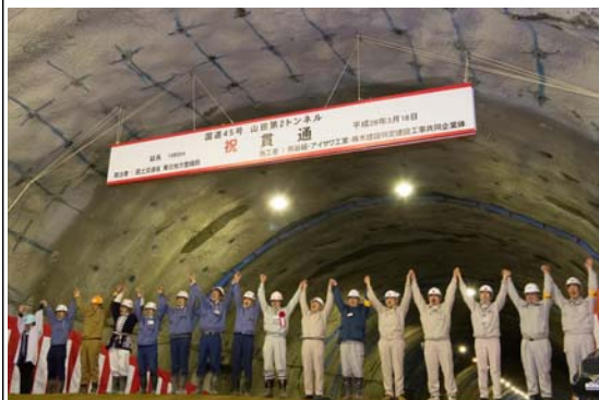
▲関係者による通り初め