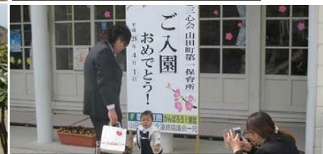
入園式(山田第1保育所 4月1日)