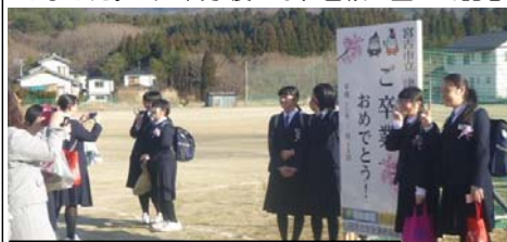
卒業式(津軽石中学校 3月15日)

山田宮古道路の工事施工者で構成する「山田宮古道路安全連絡協議会」では、小・中学校や幼稚園等の皆様に感謝の気持ちをこめて、卒業式と入学式に“おめでとう看板”を全13校に設置しました。式の終了後には、看板に並んで記念撮影をする風景も見られました。