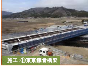
施工①東京鉄骨橋梁 株木建設

写真は山田IC(インターチェンジ)予定地です。掘削した土砂を重ダンプにて場内に運搬しています。