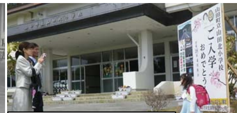
入学式(山田北小学校 4月8日)

現在、工事が全面展開しています。皆様にはご不便をお掛けいたしますが、平成29年度の開通を目標に進めてまいります。工事へのご理解とご協力を何卒お願いいたします。