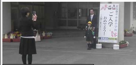
入学式(赤前小学校 4月7日)