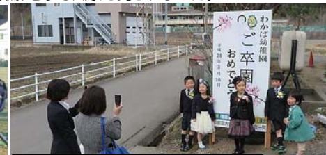
卒園式(わかば幼稚園 3月16日)