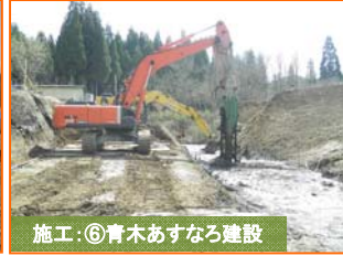
施工⑥青木あすなろ建設

写真は国道45号豊間根橋です。既設橋梁を撤去するために、鋼矢板を打ち込んでいます。