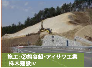
施工②熊谷組・アイサワ工業 株木建設V

写真は間木戸地区です。山田IC(インターチェンジ)付近の盛土工事を鋭意進めています。