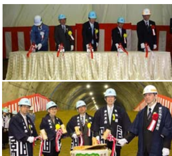
▲関係者による「貫通発破」&「鏡開き」