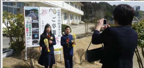
卒業式(山田北小学校 3月18日)