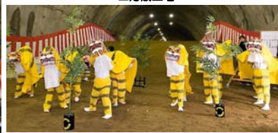
▲山田第1保育所園児による「境田虎舞」