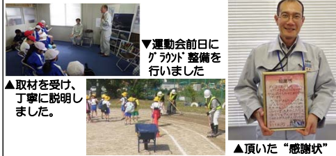
▲取材を受け、丁寧に説明しました。