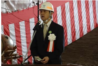
▲挨拶 (永井三陸国道事務所長)