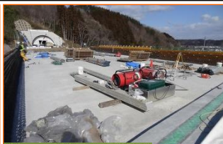
施工：⑬オリエタル白石