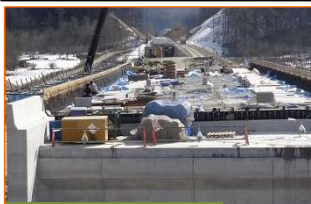
施工：⑫東京鐵骨橋梁