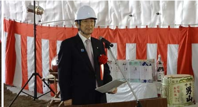
▲祝辞 (佐藤山田町長)