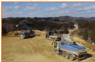
施工：⑥青木あすなろ建設