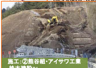
施工：②熊谷組・アイサワ工業 株木建設Ⅳ

写真は(仮称)山田第1トンネルの釜石側入口(間木戸地区)です。先日貫通式が行われました。(裏面参照！)