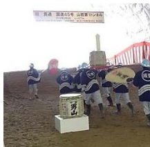
▲関係者による「樽神興」&「饗開き」