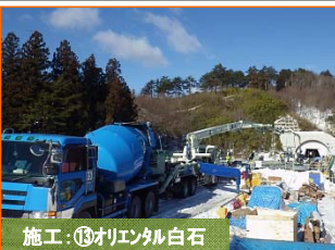
施工:⑬オリエタル白石