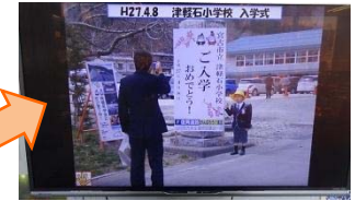
▲▼見学会等の画面が見れます!