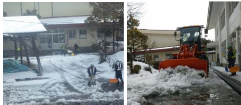
▲山田北小学校の除雪(戸田建設)