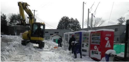
▲田名部バス停(熊谷組JV&小原建設)