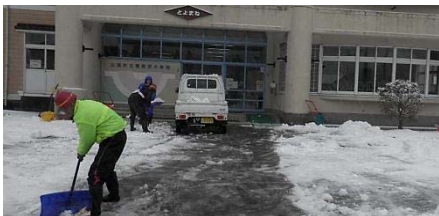
▲豊間根小学校の除雪(小原建設)

1月18(月)に、急速に発達した低気圧の影響で、県内では暴風雪や大雪に見舞われました。山田・宮古地区も例外ではなく荒れた天気となったことから、山田宮古道路の工事施工者で構成する「山田宮古道路安全連絡協議会」では、日頃の感謝の気持ちを込めて、山田町立大沢・山田北・豊間根小学校および豊間根中学校・保育園や町道等の除雪作業を18~20日(月~水)にかけて行いました。