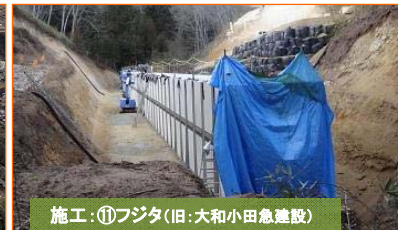
施工:⑪フジタ(旧:大和小田急建設)

写真は津軽石根井沢地区です。 道路改良(土砂搬出作業)工事及びボックスカルバート据付工事が契約になりました。よろしくお願いたします。