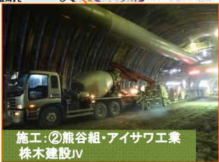
施工:②熊谷組・アイサフ工業株木建設JV