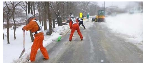
▲町道も除雪しました(東急建設&東京鐵骨橋梁)