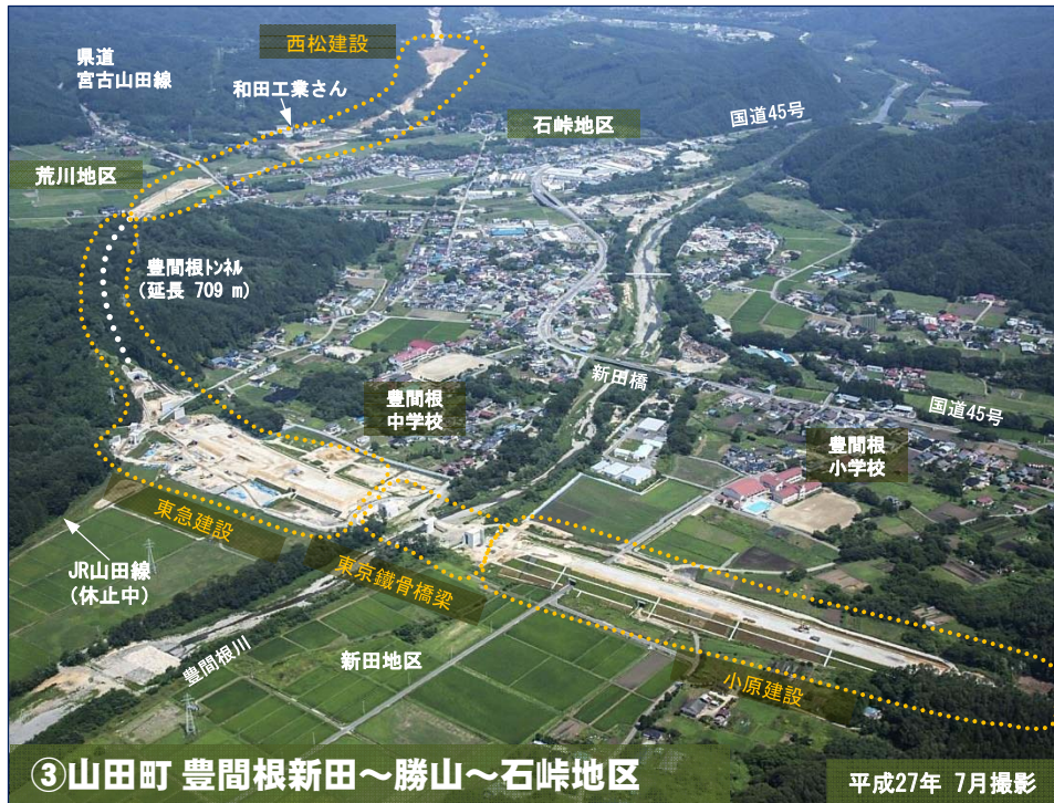
③山田町 豊間根新田～勝山～石峠地区