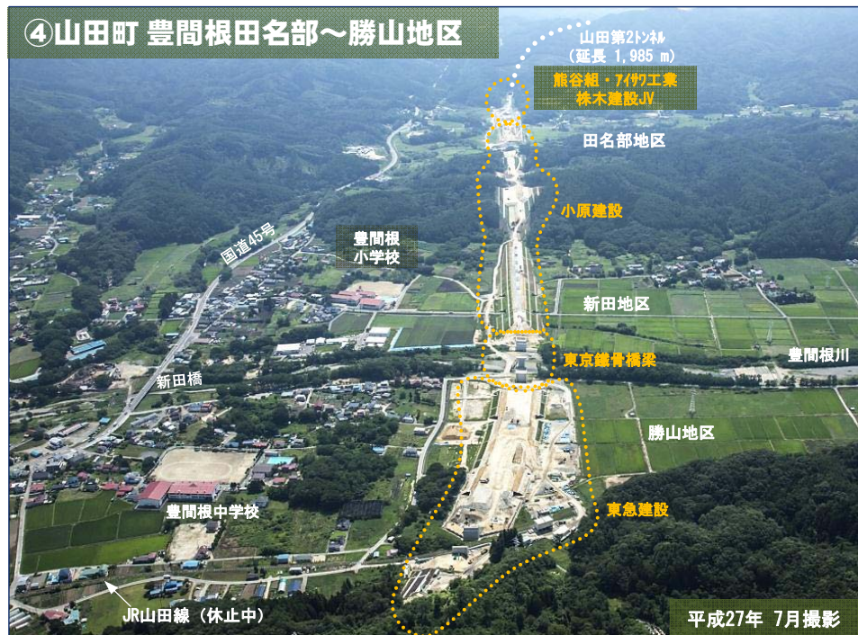
④山田町 豊間根田名部～勝山地区