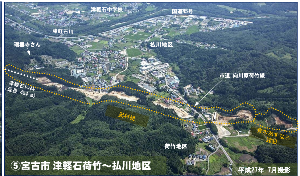
⑤宮古市 津軽石荷竹～弘川地区