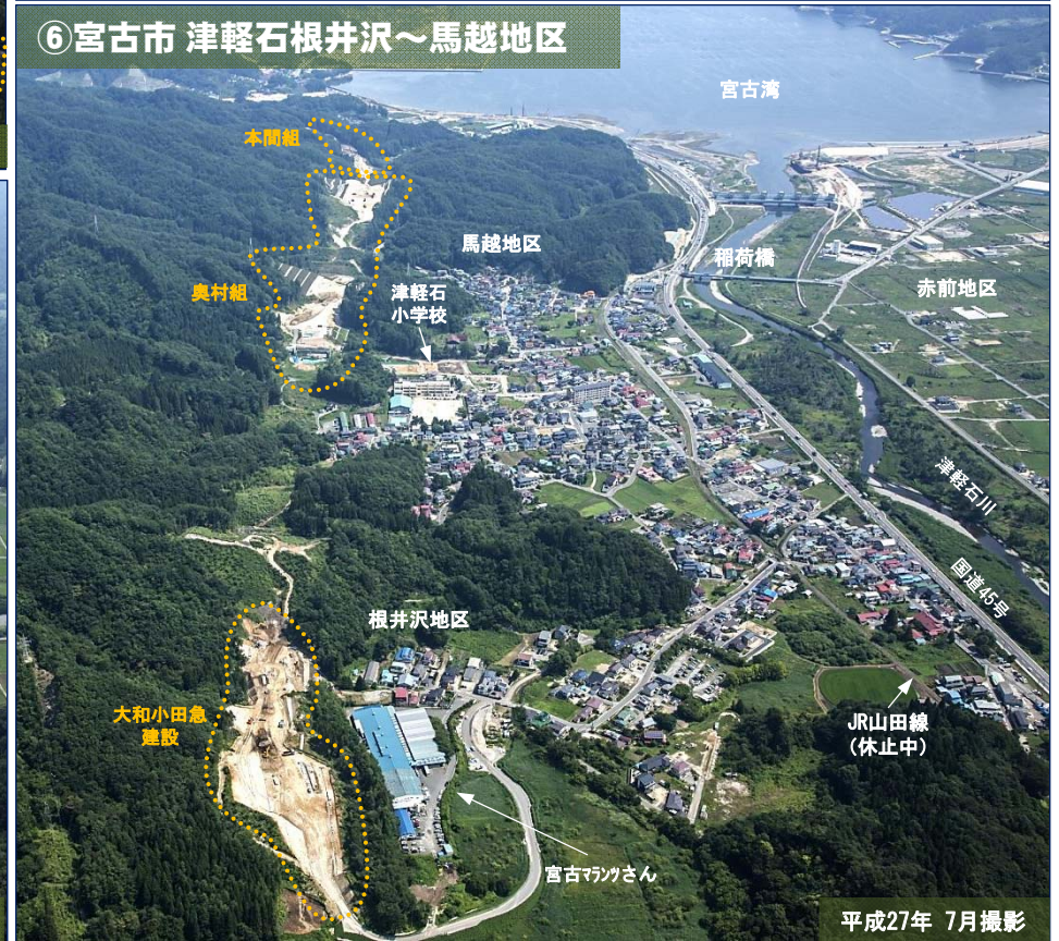
⑥宮古市 津軽石根井沢～馬越地区