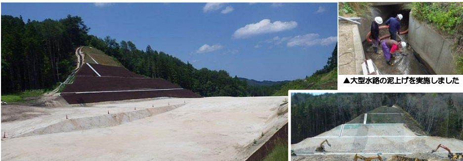
▲大型水路の泥上げを実施しました

宮古市津軽石馬越地区で実施していました、津軽石北地区道路改良工事が終了しました。主な工事内容は、土砂掘削(約7万m 3 )及び、法面工、工事用道路造成等です。工事が概ね終了した際には、今後の大雨や台風に備えて、津軽石川までつながる大型水路に溜まった土砂を、バキュームを使って除去しました。