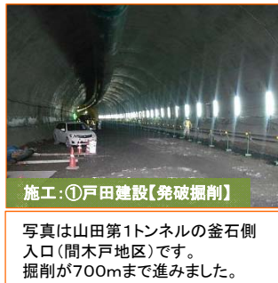
施工：①戸田建設【発破掘削】

写真は山田第1トンネルの釜石側入口（間木戸地区）です。掘削が700mまで進みました。