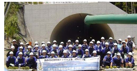
▲トンネル入口をバックに記念撮影