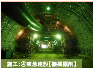
施工：④東急建設【機械掘削】

写真は山田第2トンネルの宮古側入口（豊間根下田名部地区）です。掘削が480mまで進みました。