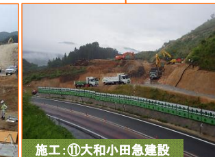
施工：⑪大和小田急建設

写真は津軽石根井沢地区です。ヒューム管（φ1.5m）の据付作業を実施しています。