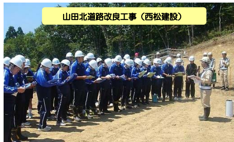
▲工事の概要説明を真剣に聞いています。

7月10日(金)に、津軽石中学校の3年生(41名)及び教職員4名の皆さんが、総合学習の一環として、「山田北道路改良工事(西松建設)」及び、「豊間根トンネル工事(東急建設)」の現場を見学され、復興状況を体感していただきました。