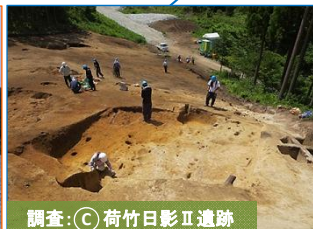
調査：⑦荷竹日影Ⅱ遺跡

写真は豊間根新田地区です。今後予定されているアスファルト舗装の下を、締め固めています。