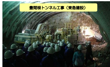
▲トンネルの掘削状況を間近で体感!