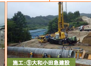
施工：⑨大和小田急建設

写真は豊間根の「スーパーびはん」さんの敷地です。8月5日（水）にインフォメーションセンターがオープンします！