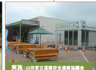
実施：山田宮古道路安全連絡協議会

荷竹日影Ⅱ遺跡の調査が終了しました。斜面地に古代の堅穴住居跡9棟などが発見されました。