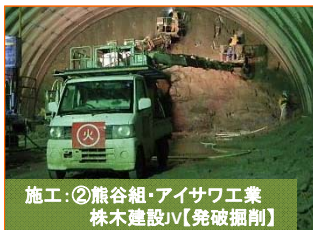
施工：②熊谷組・アイサワ工業 株木建設JV【発破掘削】

写真は山田第2トンネルの宮古側入口（豊間根下田名部地区）です。掘削が480mまで進みました。