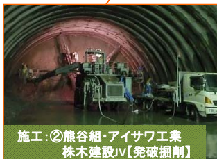
施工：②熊谷組・アイサワ工業 株木建設JV【発破掘削】

写真は山田第1トンネルの釜石側入口（間木戸地区）です。掘削が700mまで進みました。