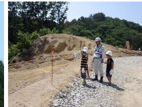
▲子供達も参加しました!