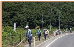
実施：山田宮古道路安全連絡協議会

写真は津軽石根井沢地区です。 設置したBOXカルバートを埋戻して、盛土作業を実施しています。