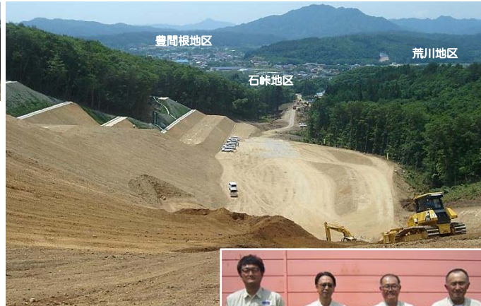
◀払川交差点で街頭指導を行いました。