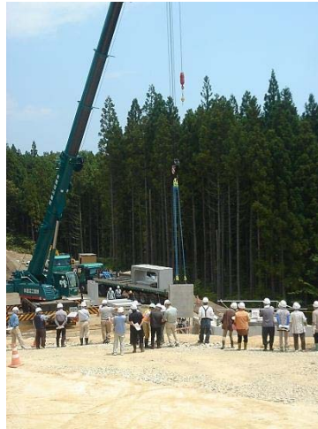
▲BOX部材の吊上げ作業を見学しました

6月20日(土)に、宮古市金浜地区の地域住民を対象とした現場見学会を開催いたしました。当日は22名(うち小学生3名)の方が現場に訪れました。設置済みのカルポートBOXの中でテレビモニターを使用して工事の概要を説明し、その後にBOXの据付作業を見学いたしました。「現場の様子が間近で見れて良い経験になりました」「今回の現場以外でも、また参加したい」「一日も早い山田宮古道路の開通が待たれます」「クレーンがカッコイイと思った。将来僕も立派な運転手になりたい」といった多くの声が寄せられました。