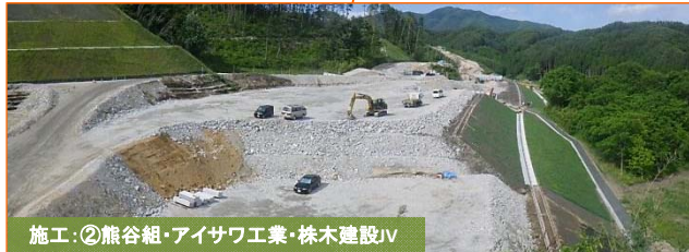
施工：②熊谷組・アイサワ工業・株木建設JV

写真は山田IC(インターチェンジ)予定地です。(山田町山田地区)盛土作業を鋭意進めています。一番高いところで5段(約25m)立ち上がります。引き続き、ご協力よろしくお願いいたします。