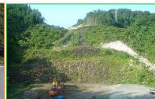
施工：⑩宮古地方森林組合

協議会では毎月道路環境整備を実施しています。今回は津軽石根井沢地区(国道45号)で草刈を行いました。