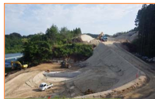
施工：⑨大和小田急建設

写真中央の赤線内は、伏籠(ふせがめ)とよばれる深鉢を伏せて埋めたものが発見されました。