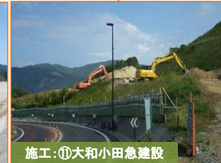
施工：⑩大和小田急建設

写真は津軽石馬越地区です。土砂搬出作業が概ね終了し、法面の植生作業を実施しています。