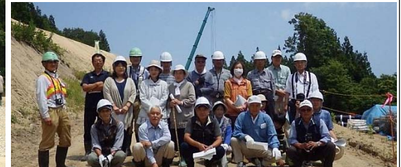
▲大型クレーンがバツに記念撮影しました