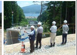
▲奥には宮古湾が望めます!