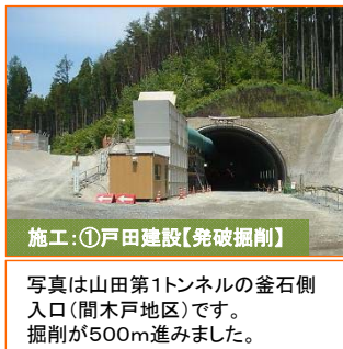
施工:①戸田建設【発破掘削】

写真は山田第1トンネルの釜石側入口(間木戸地区)です。掘削が500m進みました。