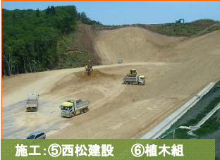
施工:⑤西松建設 ⑥植木組

写真は山田第2トンネルの宮古側入口(豊間根下田名部地区)です。掘削が440m進みました。