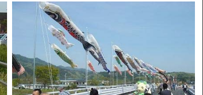
▲ゴールデンウィーク中は鯉のぼりが揚がりました

現在、工事が全面展開しています。皆様にはご不便をお掛けいたしますが、平成29年度の開通を目標に進めてまいります。工事へのご理解とご協力を何卒お願いいたします。