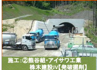
施工:②熊谷組・アイサワ工業 株木建設JV【発破掘削】

写真は山田第1トンネルの釜石側入口(間木戸地区)です。掘削が500m進みました。