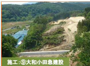
施工:⑨大和小田急建設

根井沢穴IV遺跡の調査が終了しました。小面積ながら、製鉄炉を伴う工房跡が4基も見つかりました。