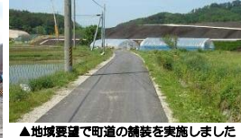
▲地域要望で町道の舗装を実施しました