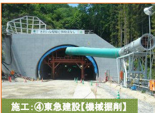
施工:④東急建設(機械掘削)

写真は豊間根下田名部地区です。大日本土木さん担当分が完成いたしました。(詳細は裏面で！)