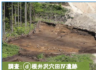
調査:④根井沢穴IV遺跡

根井沢穴IV遺跡の調査が終了しました。小面積ながら、製鉄炉を伴う工房跡が4基も見つかりました。