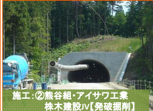
施工:②熊谷組・アイサワ工業 株木建設JV【発破掘削】

写真は山田第2トンネルの宮古側入口(豊間根下田名部地区)です。掘削が440m進みました。