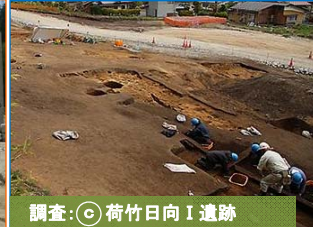
調査:③荷竹日向I遺跡

写真は津軽石荷竹地区です。七田川橋の杭打ち作業を開始いたします。よろしく願っています。