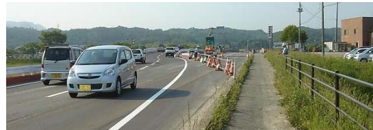
▲通行が仮橋に切り替わりました。

国道45号の豊間根橋の通行が、5月25日(月)、仮橋に切り替わりました。今後は豊間根橋の撤去作業に入りますので、引き続きよろしくをお願いいたします。(施工担当:西松建設) スピードの出しすぎに注意し、安全運転の程よろしくをお願いいたします。