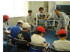
▲丁寧にわかりやすく説明しました