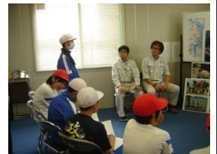
▲鋭い質問もたくさん出ました!