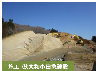
施工:⑨大和小田急建設

写真は津軽石根井沢地区です。土砂の搬出作業を行っています。よろしくお願いいたします。