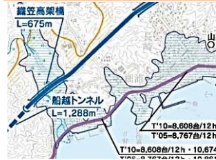
施工:②熊谷組・アイサワ工業・株木建設JV

山田第1トンネルから掘削されたズリ(岩)は高浜地区の防潮堤工事(岩手県)にも活用されています。