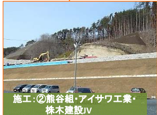
施工：②熊谷組・アイサワ工業・株木建設JV

写真は山田インターチェンジ予定地です。盛土作業が3段目に入りました。一番高いところで5段あります。