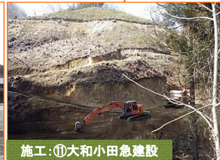
施工：⑪大和小田急建設

写真は津軽石荷竹地区です。表土を山田町織笠地区の圃場整備事業(岩手県)に搬出しています。