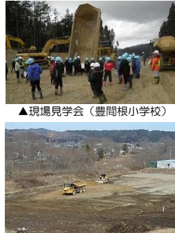
▲現場見学会(豊間根小学校)

山田町豊間根新田地区で実施していました豊間根地区道路改良工事が概ね終了しました。主な工事内容は、土砂掘削(約17万m 3 )及び盛土工事(約14万m 3 )、法面工、排水構造物工事です。隣接している豊間根地区圃場整備事業と調整を図りながら工事を進めて参りました。