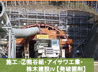
施工：②熊谷組・アイサワ工業・株木建設JV【発破掘削】

写真は山田インターチェンジ予定地です。盛土作業が3段目に入りました。一番高いところで5段あります。