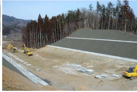
▲山を削って盛土を行いました