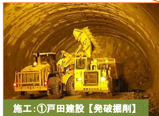
施工：①戸田建設【発破掘削】

山田第1トンネルの釜石側入口(間木戸地区)のズリ(岩)出し状況です。掘削が410mまで進みました。