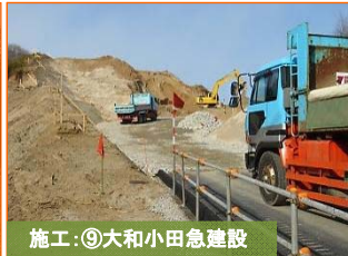
施工：⑨大和小田急建設

写真は石峠地区です。土砂の搬出を進めています。ご迷惑をお掛けしますがよろしくお願いいたします。