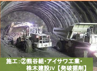
施工：②熊谷組・アイサワ工業・株木建設JV【発破掘削】

山田第2トンネルの宮古側入口(豊間根田名部地区)の掘削状況です。掘削が360mまで進みました。