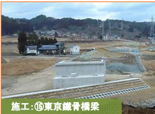
施工：⑩東京経済橋梁

豊間根トンネルの釜石側入口(豊間根勝山地区)の掘削状況です。掘削が340mまで進みました。