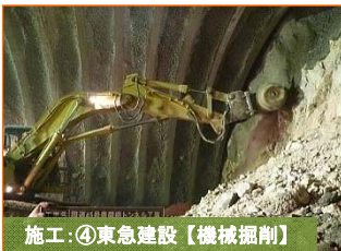
施工：④東急建設【機械掘削】

写真は豊間根勝山地区です。JR山田線(休止中)を跨ぐ豊間根跨線橋の橋台が概ね完成しました。