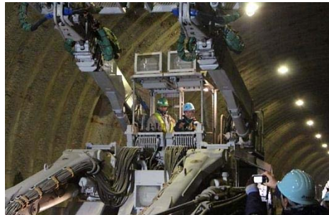
▲トンネル工事に使用する大型機械に乗り込んで操作体験!