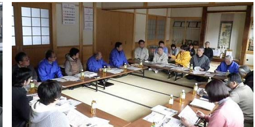
▲定期会議の様相(津軽石竹自治会館にて)