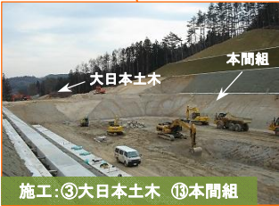
施工:③大日本土木 ⑬本間組

写真は山田地区(林道間木戸線)です。トンネルのスリ(岩)を細かく破碎し再利用する予定です。