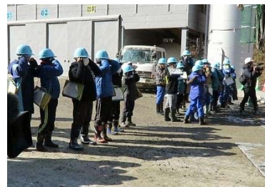
▲発破作業を体験!(4・5・6年生)

現場見学会の様子は、山田町観光協会の公式ブログ「山田とこと日記」でも情報発信しておりますので、是非ご覧ください! URLはこちら(カテゴリ:復興道路)→ http://yamada-kankou.sblo.jp/category/3906911-1.html