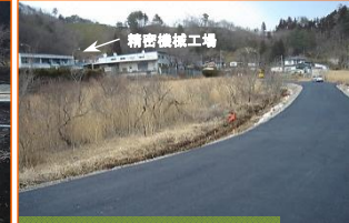
施工:⑨大和小田急建設

写真は津軽石根井沢地区です。工事用道路が概ね完成しました。3月から土砂搬出を開始します。