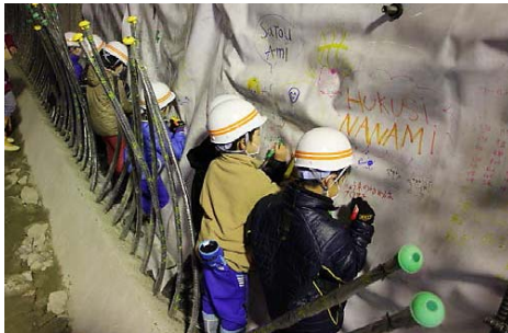
▲トンネル内部の防水シートに将来の夢等を書き込みました

2月10日(火)に大沢小学校の全校児童(86名)及び教職員9名の皆さんが「山田第2トンネル」の現場を見学されました。防水シートに将来の夢や目標などを書いたり、重機の操作も体験しました。また高学年(4・5・6年生)を対象に、発破作業も体験していただきました。