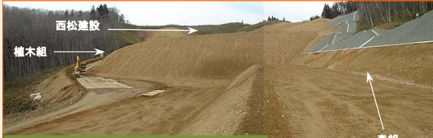
施工:⑤森組 ⑥植木組 ⑫西松建設

写真は豊間根勝山地区です。橋を架ける工事が契約となりました。よろしくお願いたします。