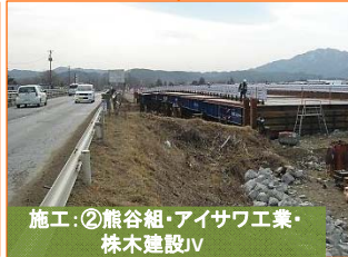
施工:②熊谷組・アイサワ工業・株木建設JV

写真は国道45号豊間根橋です。仮橋が概ね完成しました。4月下旬頃に切替えを予定しております。