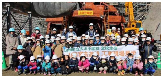
▲山田第2トンネル(釜石側入口)で記念撮影(1・2・3年生)