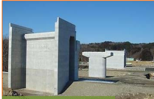
施工:④東京鐵骨橋梁

写真は豊間根勝山地区です。橋を架ける工事が契約となりました。よろしくお願いたします。