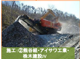
施工:②熊谷組・アイサワ工業・株木建設JV

写真は山田地区(林道間木戸線)です。トンネルのスリ(岩)を細かく破碎し再利用する予定です。