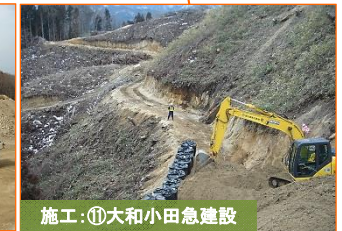
施工:⑪大和小田急建設

写真は津軽石馬越地区です。掘削及び土砂搬出を実施中です。よろしくお願いたします。