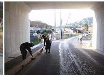
▲人手による路面清掃(山田町豊間根田名部地区)