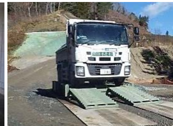
▲泥落とし装置(宮古市津軽石馬越地区)