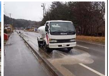
▲散水車による清掃(山田町石峠地区)