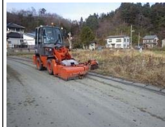
▲清掃車による路面清掃(宮古市津軽石根井沢地区)

今後も気温や天候を見ながら、できる限りの対策をとってまいりますので、ご理解いただきますようお願いいたします。