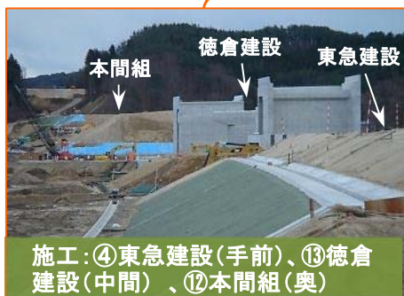
施工:④東急建設(手前)、⑬徳倉建設(中間)、⑫本間組(奥)