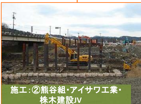
施工:②熊谷組・アイサワ工業・株木建設JV

写真は国道45号豊間根橋です。仮橋設置作業を鋭意進めております。よろしくお願いいたします。