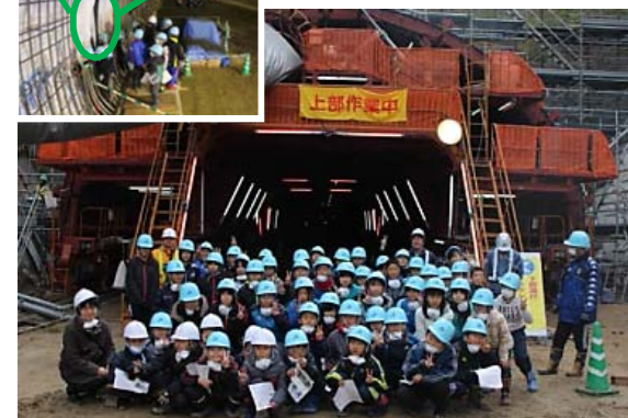
▲豊間根小学校(山田第2トンネル)