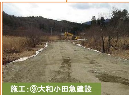
施工:⑨大和小田急建設

写真は国道45号豊間根橋です。仮橋設置作業を鋭意進めております。よろしくお願いいたします。