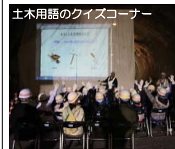
土木用語のクイズコーナー