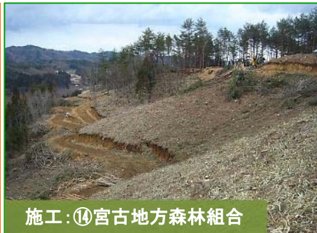
施工:⑭宮古地方森林組合

写真は豊間根荒川地区です。豊間根トンネル(宮古側入口)付近の法枠を実施しております。