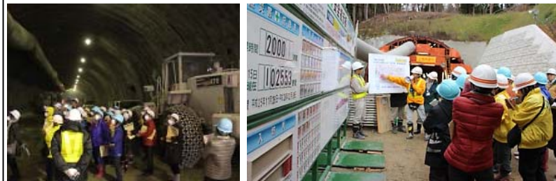
▲明日を拓く宮古のみち女性の会(山田第2トンネル)

また、山田町内の小学校(2校)からのご要望を受け、11月28日(金)に山田北小学校の5・6年生(27名)及び教職員3名の皆さんが、「山田第1トンネル」の現場を見学され、12月4日(木)には、豊間根小学校の全校生徒(98名)及び教職員9名の皆さんが「山田第2トンネル」及び「豊間根小学校の近くにある工事区間(本間組)」の現場を見学されました。