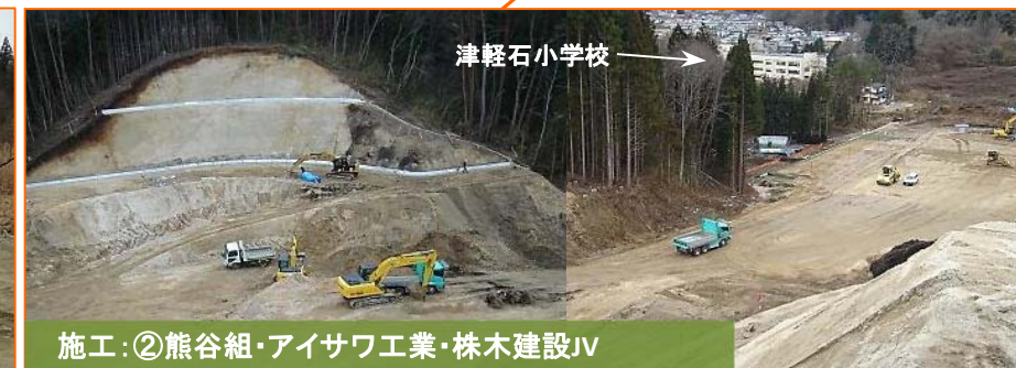
施工:②熊谷組・アイサワ工業・株木建設JV

写真は津軽石根井沢地区です。道路本線の工事をするための工事用道路を造成しております。