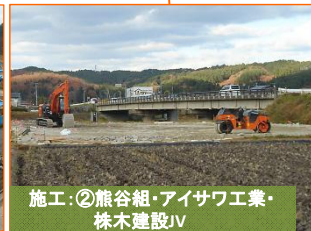
施工②熊谷組・アイサワ工業・株木建設JV

写真は豊間根勝山地区です。(仮称)豊間根二線橋(橋台2基)の躯体を立ち上げています。