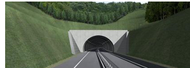
▲完成イメージ(釜石側入口)