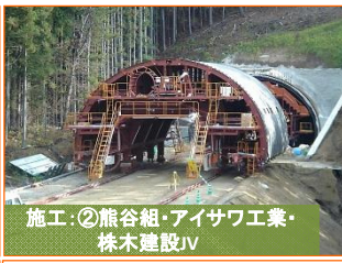
施工②熊谷組・アイサワ工業・株木建設JV

写真は間木戸地区です。山田IC(インターチェンジ)内の盛土作業を実施しております。2段目を施工中です。