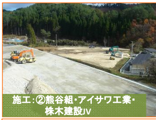
施工②熊谷組・アイサワ工業・株木建設JV

写真は間木戸地区です。山田IC(インターチェンジ)内の盛土作業を実施しております。2段目を施工中です。