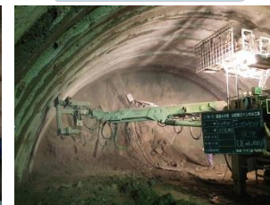
▲コンクリートをトンネルの壁面に吹き付けて、トンネルが崩れないように固めます。