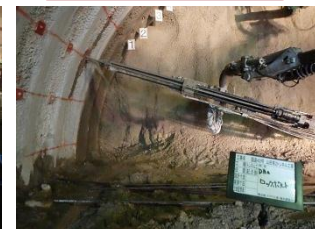
▲トンネルの壁面から放射状にロックボルト(長さ3~6mの鉄製の棒)を打込み、トンネルと地山を一体化させ、補強します。