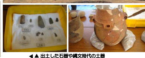
▲出土した石器や縄文時代の土器

今後、工事が全面展開していきます。皆様にはご不便をお掛けいたしますが、1日も早い復興道路の開通を目指しますので、工事へのご理解とご協力をお願いいたします。