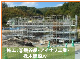
施工②熊谷組・アイサワ工業・株木建設JV