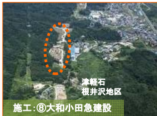
施工⑧大和小田急建設