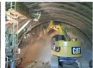
▲発破後に落下しそうな石、浮いた石を削岩機で落とす、切羽表面を整えます。