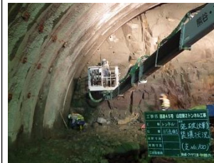
▲ドリルジャンボで切羽に穴を開け、火薬をセットします。