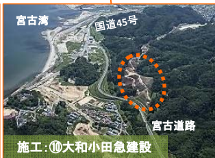
施工⑳大和小田急建設

宮古南IC(インターチェンジ)付近の道路改良及びボックスカルバート据付工事が契約になりました。