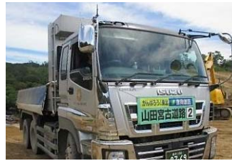
▲写真のダンプトラックは山田第2トンネル工事(施工:熊谷組・アイサワ工業・株木建設JV)で土砂運搬しています。