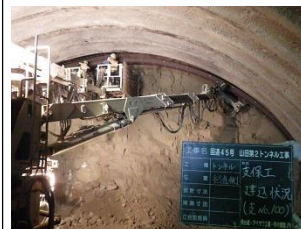
▲トンネルの形状に合わせた鋼製の枠を周囲に難込み、枠の間に金網を取付け、地山の落下防止を図ります。