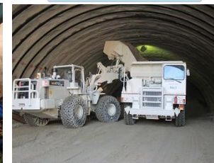
▲崩した岩(ズリ)をホイールローダでダンプトラックに積み込んで坑外へ搬出します。