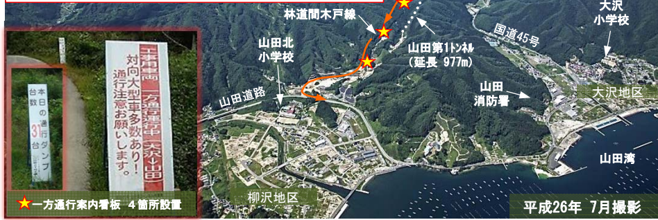
★一方通行案内看板 4箇所設置

トナリから出た土砂(岩)を積んだダンプトラックが、林道間木戸線を一方通行(大沢→山田方面)で走行しております。ご迷惑をお掛けしておりますが、ご理解・ご協力をお願いいたします。