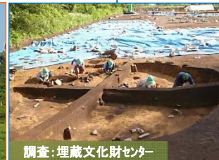
調査: 埋蔵文化財センター

写真は豊間根新田地区です。盛土作業を鋭意進めています。完成すると、約13mの高さとなります。