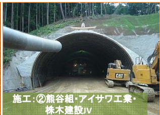
施工: ②熊谷組・アイサワ工業・株本建設JV

大沢地区で掘削作業を進めています。もう一段(高さ約7m)掘り下げる計画となっています。