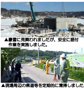
▲豪雪に見舞われましたが、安全に据付作業を実施しました。