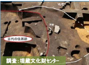
調査: 埋蔵文化財センター