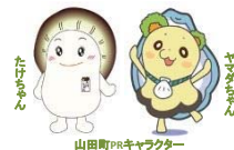
山田町PRキャラクター