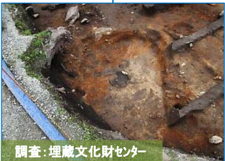
調査: 埋蔵文化財センター

縄文土器がたくさん捨てられている地点を掘り下げたところ、竪穴住居跡が見つかりました。