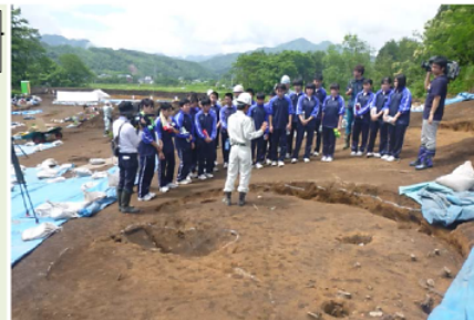
▲石峠Ⅱ遺跡(9,698㎡)では、縄文時代中期の竪穴住居や竪穴などが検出されています。

参加した生徒の皆さんからは、「土器を掘る大変さや土器の貴重さがよくわかりました」などの感想をいただきました。どうもありがとうございました。