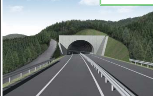
▲山田第1トンネル(釜石側)