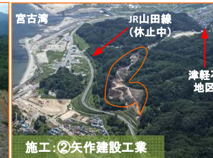
施工：②矢作建設工業

山田第2トンネルの北側入口(宮古側)で掘削作業を開始しました。よろしくお願いたします。