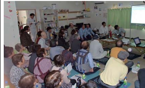
▲山田第1、第2トンネル工事の説明会の様子

皆様にはご迷惑をお掛けすることないように努めて参りますので、ご理解とご協力の程よろしくお願いたします。