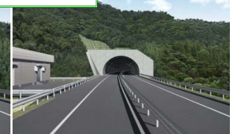
▲豊間根トンネル(釜石側)

今後、工事が全面展開していきます。皆様にはご不便をお掛けいたしますが、1日も早い復興道路の開通を目指しますので、工事へのご理解とご協力をお願いいたします。