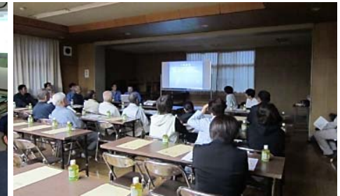
▲豊間根トンネル工事の説明会の様子