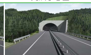
▲山田第2トンネル(宮古側)