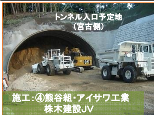
施工：④熊谷組・アイサワ工業 株木建設JV