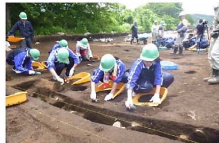
▲土器などを傷つけないよう、スコップや竹へらで丁寧に土を削っていきます。

くわしくは、 三陸国道事務所 地域づくり相談室 0193-71-1711 までお気軽に。