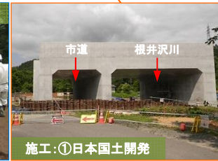
施工：①日本国土開発