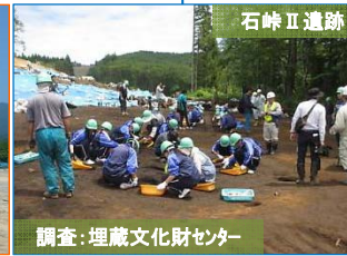
調査：埋蔵文化財センター