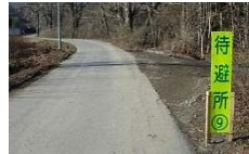
▲ 市道が狭いため、16箇所待避所を設置しました。