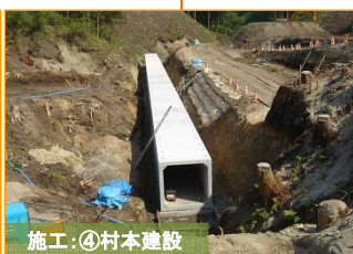
大沢地区で3基目のボックスカルバートの設置作業が終了しました。引き続き4基目の準備を進めています。