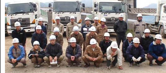
▲ 土砂運搬等で協力頂いた皆さん