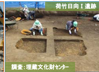
調査区の西側で竪穴状の遺構の精査を開始しました。周辺から中世の古銭が見つかっています。