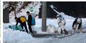
▲ 2月の豪雪時には津軽石バス停付近や周辺の市道除雪を実施しました。