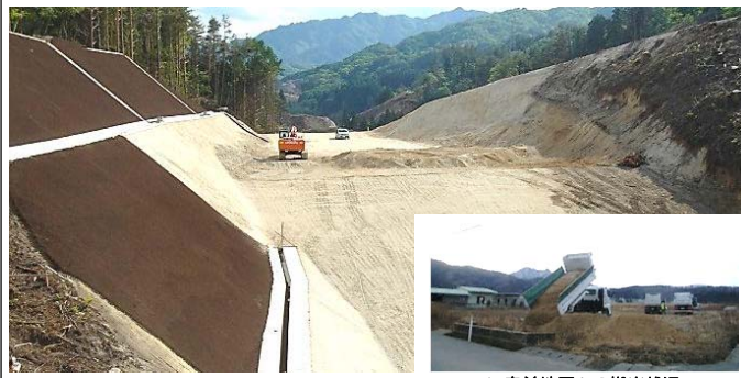
▲ 赤前地区への搬出状況

宮古市津軽石の馬越地区で実施していました馬越地区道路改良工事が概ね終了しました。主な施工内容は道路改良（土砂掘削及び運搬 約90,000㎡）、法面工、排水構造物工です。掘削した土砂は、山田宮古道路に利用されたほか、宮古市津軽石赤前地区の防災集団移転促進事業や、山田町小谷鳥地区の農用地災害復旧事業等にも活用されました。