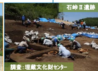
写真手前では、縄文時代の竪穴住居跡の形を出す作業を行っています。