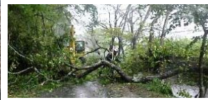
▲ 10月の台風時には市道新町根井沢線の倒木除去を実施しました。