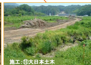
写真は下田南部地区です。田名部川に仮橋を設置する準備を進めています。