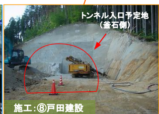
山田第1トンネルの南側入口(坑口)で掘削作業のための準備を進めています。