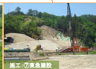
JR山田線(休止中)を跨ぐ豊間根二線橋の工事が始まりました。よろしくお祈りいたします。