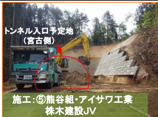
トンネル入口予定地 (宮古側) 施工: ⑤熊谷組・アイサワ工業 株木建設JV