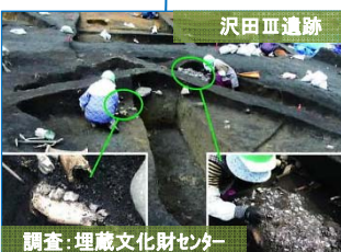
調査: 埋蔵文化財センター 平安時代の竪穴住居から獣骨や貝殻が見つかりました。左下写真の骨はシカの下顎骨です。