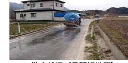
▲ 散水状況（豊間根地区）