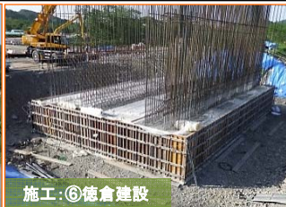
豊間根川橋の下部工(橋台)のコンクリート打設を実施しました。引き続き、躯体を立ち上げていきます。