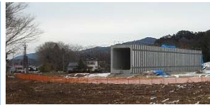
▲ 荷竹地区で延長50mのボックスカルバートを設置しました。