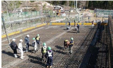
▶ コルバート打設状況です。全体で約2,000㎡使用しました。