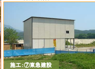
豊間根トンネルで使用される生コンクリートを製造するための設備です。山田第1、2トンネルでも作っています。