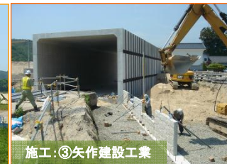
写真は町道白山船石線です。BOXカルバート周辺の盛土作業を実施するため、擁壁を造っています。