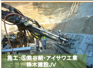
施工：⑤熊谷組・アイサワ工業 株木建設JV