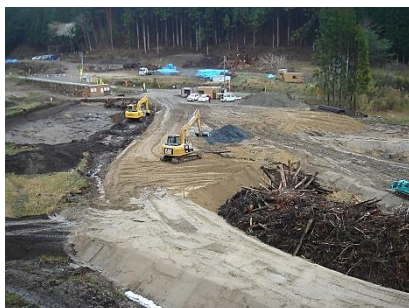
▲山田IC内の工事用道路造成状況