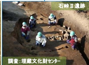
調査：埋蔵文化財センター