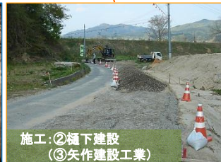
施工：②橋下建設 (③矢作建設工業)

沢田地区の調査状況です。昨年度に引き続き縄文時代や古代の住居跡が見つかっています。