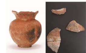
▲右が沼里遺跡から出土した土器