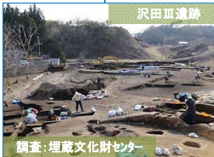
調査：埋蔵文化財センター