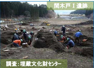
調査：埋蔵文化財センター