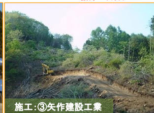
施工：③矢作建設工業