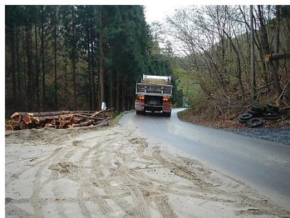
▲ダンプトラックの走行状況 (施工：熊谷組・アサヒ工業・株木建設JV)

山田町間木戸～大沢区間の林道間木戸線で、土砂運搬のためのダンプトラックが通行しています。既存の待避所のほか、新たな待避所の造成作業も進めております。皆様にはご不便をお掛けいたしますが、ご理解とご協力の程お願いいたします。