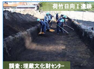
調査：埋蔵文化財センター