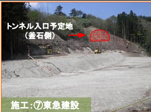
トンネル入口予定地（釜石側）