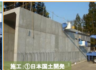
施工：①日本国土開発