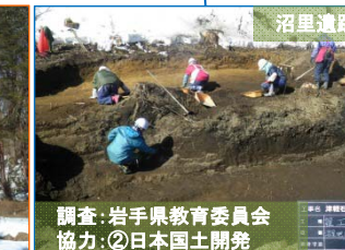
調査:岩手県教育委員会協力:②日本国土開発