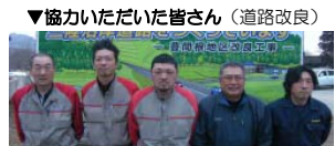
山崎建設(株) 吉川建設(株)