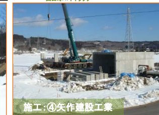
施工:④矢作建設工業