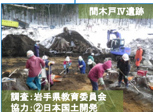
調査:岩手県教育委員会協力:②日本国土開発