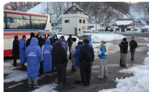
▲宮古盛岡横断道路起点(藤原埠頭出入り口付近)で現場研修