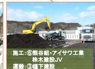
施工:⑥熊谷組・アイサフ工業 株木建設JV 運搬:③樋下建設