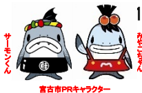
宮古市PRキャラクター