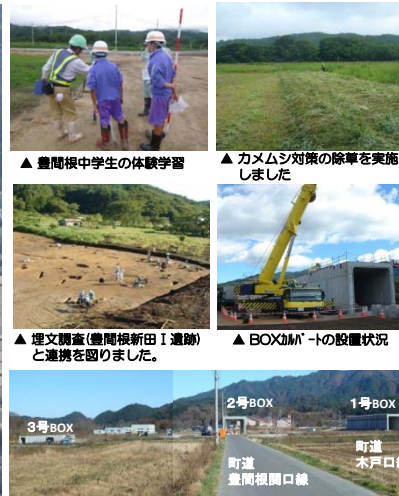
▲豊間根中学生の体験学習 ▲カメラシオ除草を実施しました ▲埋文調査(豊間根新田Ⅰ遺跡)と連携を図りました。 ▲BOXカルバートの設置状況 3号BOX 2号BOX 1号BOX 町道 豊間根開口線 町道 木戸口線