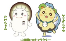
山田町PRキャラクター