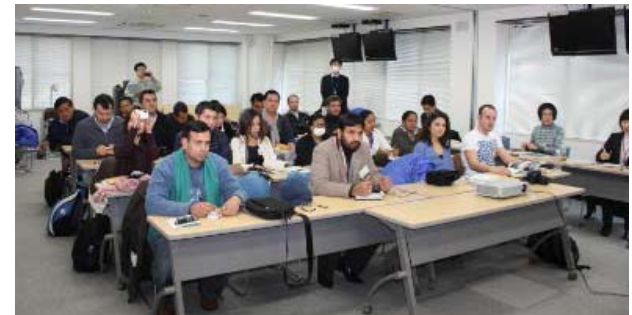
▲熱心に耳を傾ける参加者の皆さん

この研修プログラムの一環として、三陸国道事務所は復興道路・復興支援道路についての講義と現場研修を平成26年2月18日(火)に実施しました。