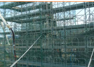
施工⑩: 宮古地方森林組合