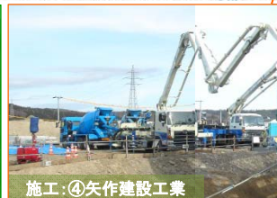
施工④: 矢作建設工業