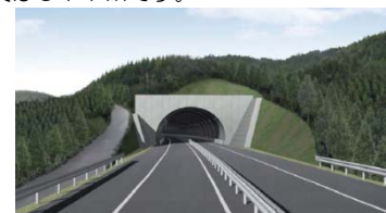
▲完成イメージ(釜石側入口)