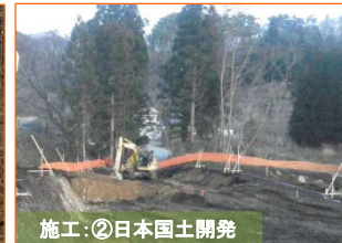
施工②: 日本国土開発

山田部地区で伐採作業を実施中です。ご迷惑をお掛けしますが、ご協力をお願いいたします。