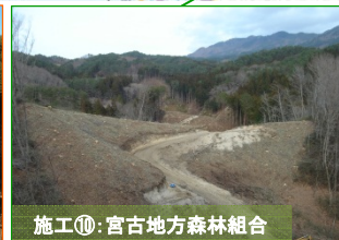
施工⑩: 宮古地方森林組合