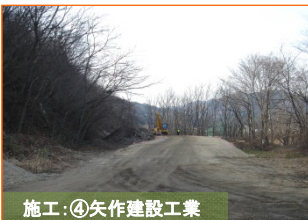
施工④: 矢作建設工業