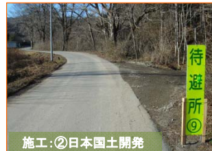
施工②: 日本国土開発