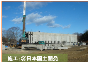
施工②: 日本国土開発