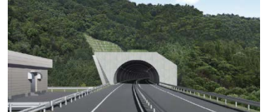
▲完成イメージ(金石側入口)

◆工事期間 自：平成25年12月14日 至：平成27年11月13日 ◆受注者 東急建設株式会社