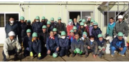
▲発掘作業員の皆さん 本当にお疲れ様でした!