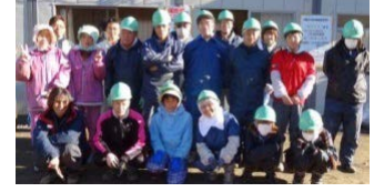
▲発掘作業員の皆さん 本当にお疲れ様でした!

宮古市津軽石第14地割で9月より調査を進めていましたが、12月6日に終了します。この遺跡からは“塚”や“製鉄炉”などがみつかりました。調査にご協力いただいた皆様ありがとうございました。