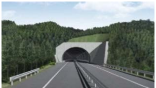
▲完成イメージ(釜石側入口)