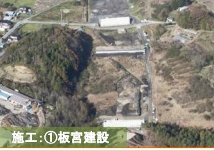
施工：①板宮建設 下田名部地区で実施しました豊間根南地区改良工事が概々終了しました。(詳細は裏面で！)