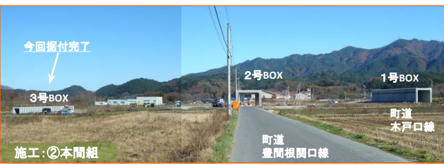
今回掘付完了 3号BOX 2号BOX 1号BOX 町道 豊間根関口橋 町道 本戸口橋 施工：②本間組 3基目のBOXカルバート(3号BOX)の掘付作業が完了しました。本間組さんの施工分はこれで終了です。まだ迂回路での通行が続きますので、引き続き工事へのご理解・ご協力をお願いいたします。