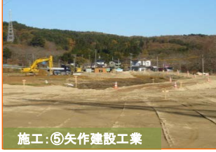
施工：⑤矢作建設工業 荒川地区の道路造成工事を実施中です。タンクトラックが頻りに走行していますのでご注意ください。