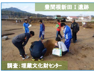
調査：埋蔵文化財センター 豊間根小学校の5、6年生(約40名)が見学に訪れました。陥し穴の跡を興味深そうに覗いていました。