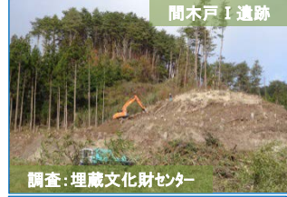
調査：埋蔵文化財センター 間木戸I遺跡の調査を進めるため、表土剥ぎを開始しました。よろしくお願いたします。