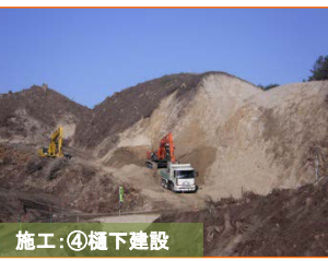
施工：④掘下建設 掘削土の積み込み・運搬状況です。荒川地区、荷竹地区及び豊間根地区等へ搬出します。