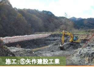
施工：⑤矢作建設工業 (仮称)荒川川橋の施工に着手しました。橋台を施工するため、床掘りを開始しています。