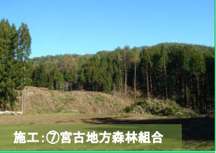
施工：⑦宮古地方森林組合 大沢地区で伐採作業を実施中です。通行にご不便をお掛けしますが、よろしくお願いたします。