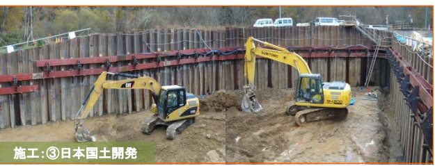
施工：③日本国土開発 根井沢工区でBOXカルバート(現場打)の施工を実施中です。掘削作業を鋭意進めています。掘削が終了すれば、地盤改良、均しコンクリートの打設、鉄筋と型枠の組み立てを実施していきます。