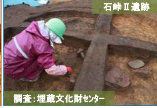
調査：埋蔵文化財センター 調査区中央では石で囲った炉(写真中央)のある竪穴住居が見つかっています。