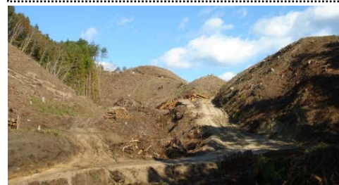
▲掘削土運搬の準備を進めている津軽石馬越地区