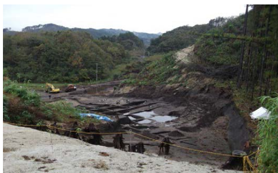
▲道路工事着前に必要な埋蔵文化財調査についても岩手県教育委員会や埋蔵文化財センターのご協力により急ピッチで進められています。