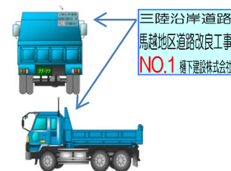
▲ステッカーを貼って運行いたします!