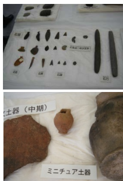
▲出土した石器や土器

山田町山田第3地割地内で発掘調査を進めていました、三陸沿岸道路建設予定地にある「沢田Ⅲ遺跡」において、10月26日(土)に現地説明会を開催しました。遺跡からは古代の鉄生産関連炉跡や縄文時代の土器などが出土し、調査終了後、三陸沿岸道路の早期開通に向け、本格的に道路工事に移行することから、遺跡を現地で見られる最後の機会ということで地元住民の方々など約40名が参加しました。