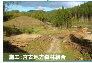
施工：宮古地方森林組合