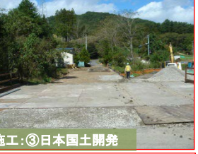
施工：③日本国土開発

間木戸地区の伐採を鋭意実施しており、間木戸 I 遺跡の調査に入る準備を進めています。