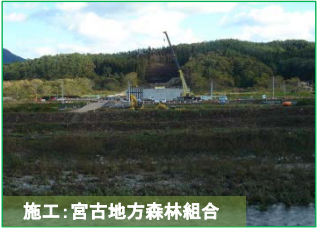
施工：宮古地方森林組合