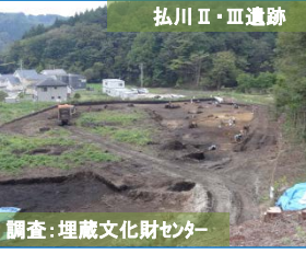
調査：埋蔵文化財センター

写真は町道豊間根関口線です。BOXカルバートの据付作業が10月下旬から始まります。