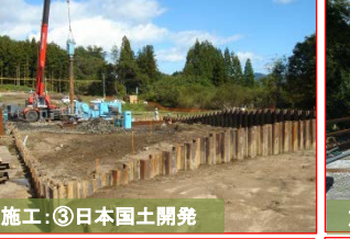
施工：③日本国土開発