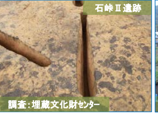
調査：埋蔵文化財センター