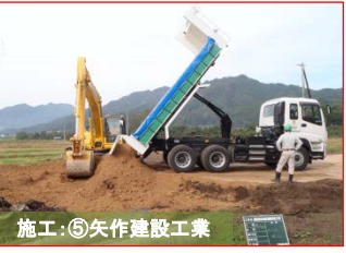
施工：⑤矢作建設工業