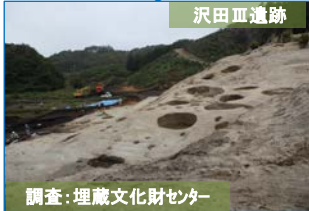
調査:埋蔵文化財センター