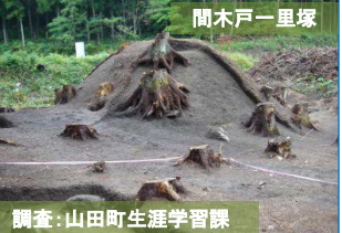
調査:山田町生涯学習課