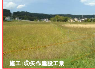
施工:⑤矢作建設工業