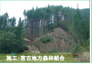
施工:宮古地方森林組合