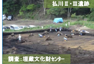
調査:埋蔵文化財センター