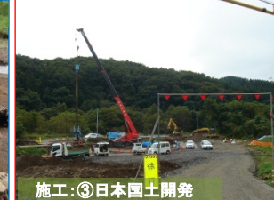
施工:③日本国土開発

大沢地区で道路改良とBOXカルバートを設置する工事が9月下旬に契約となりました。よろしくお祈りします。