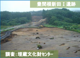
調査:埋蔵文化財センター