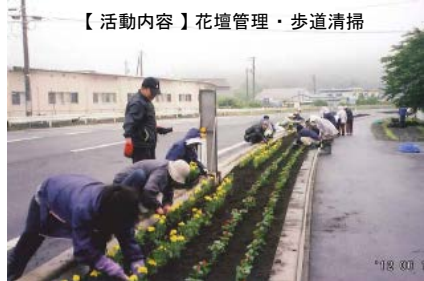
【活動内容】花壇管理・歩道清掃