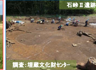
調査:埋蔵文化財センター